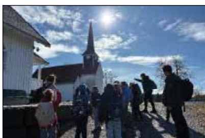
Andreklassinger på vei til besøk i Enebakk kirke.

Alle andreklasser i Enebakk var på besøk i Kirkebygda i mars, i regi av den kulturelle skolesekken. De fikk høre hele påskefortellingen i Kultursalen, besøkte kirken og fikk et innblikk i historien her. De var også på biblioteket til lesestund og utdeling av lånekort. Takk til Kulturskolen som stod for praktisk tilrettelegging.