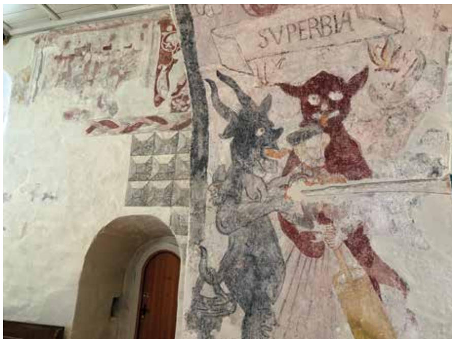
Melketyven, ferdig konservert

Kalkmaleriene i Enebakk kirke er unike i norsk sammenheng og representerer en viktig kulturarv. Motivene forteller også mye om samfunnet på 1500- og 1600-tallet. Det siste halvåret har konservatorer fra NIKU konservert bildene.