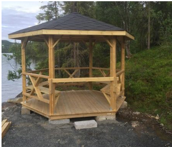
Lysthuset på vestsida av Steinsetfjorden