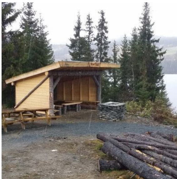
Gapahuken på vestsida