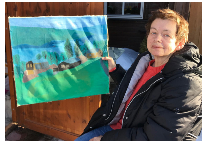
Våren kjem no