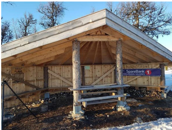
Gapahuken ved Austalidtjednet