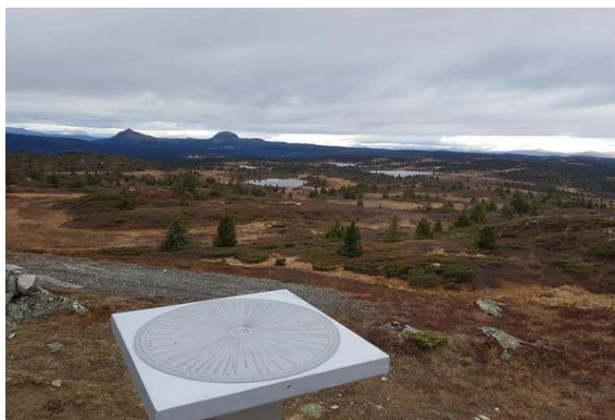
Sikteskiva på Goarn

I 2018 fekk Grendalaget laga og satt opp sikteskive på Goarn. Skiva inneheld mange punkt. Ein kan mellom anna sjå meir enn 30 toppar over 2000 moh.