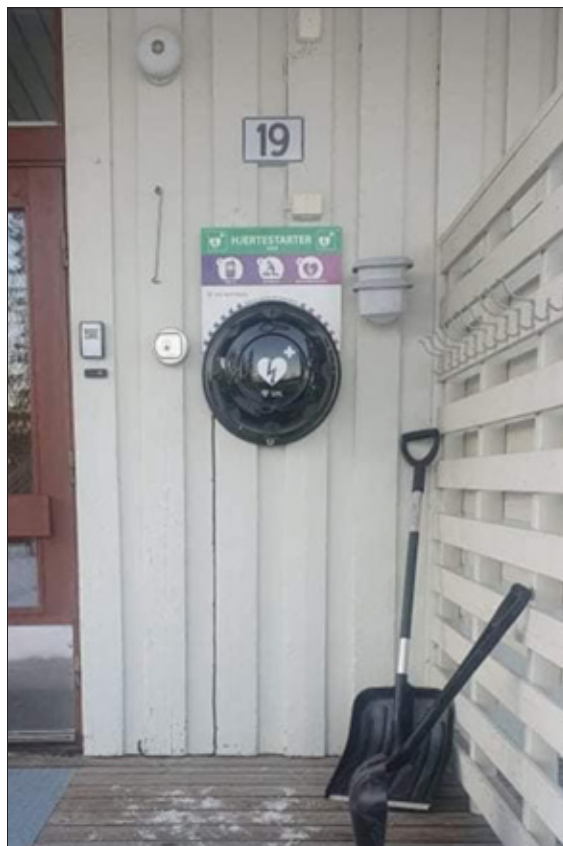
Hjertestartar montert på Grendehuset i Steinsetbygda

Grendelaget er veldig glade for å ha fått på plass ein hjertestartar i bygda, og vonar den aldri vert brukt