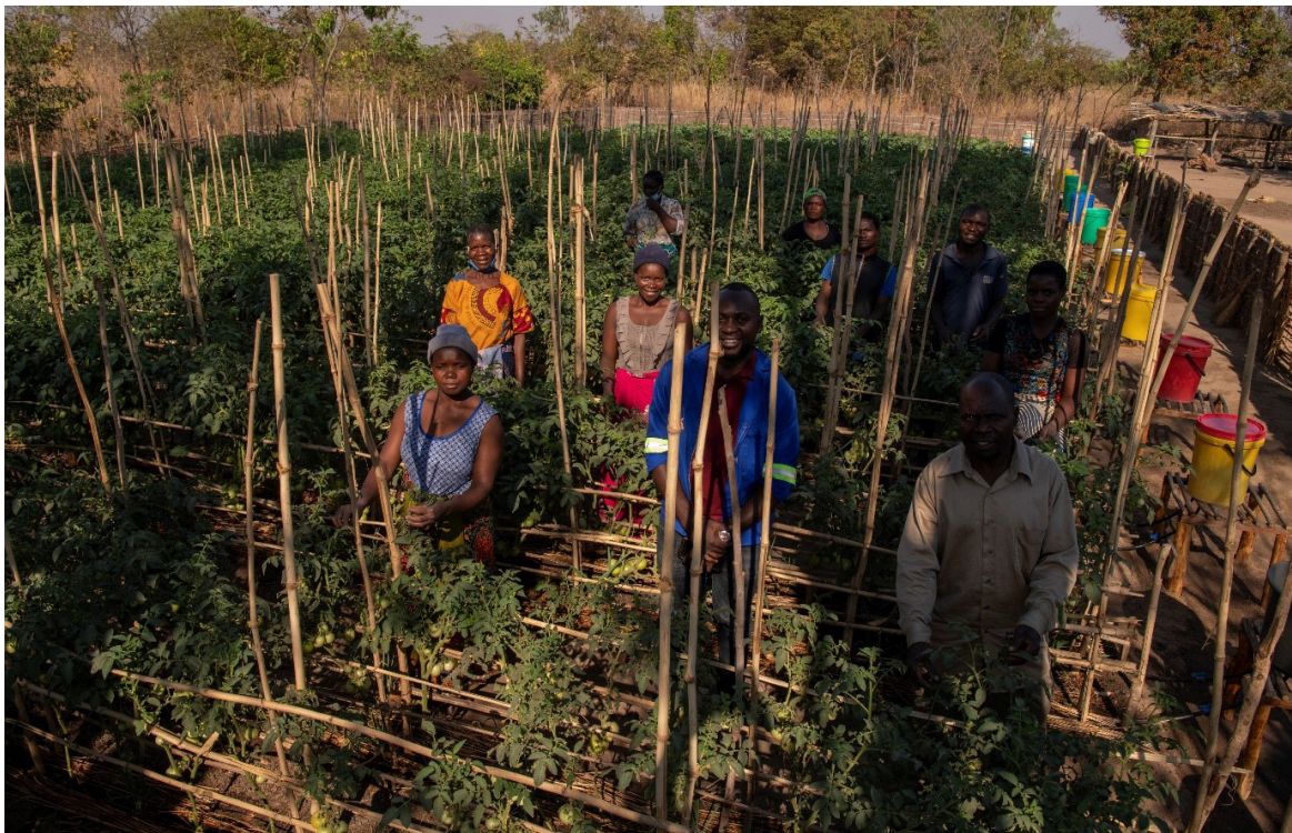
Nye metodar: Agronomen har ansvar for 17 område med 12 bønder i kvart område. Han lærer dei om nye metodar og korleis ein får mest ut av grønsakakeren sin.

– Målet mitt er å få andre til å sjå korleis dei sjølv kan endre liva sine. Som nyutdanna håpa eg at eg skulle få oppfylt draumen min om å jobbe i Kyrkjens Nødhjelp. No gjer eg det, og det gjer meg glad og takksam. Måten Kyrkjens Nødhjelp jobbar med lokalsamfunn på, er riktig og viktig. Eg er veldig stolt over at eg får vere med på å forandre verda.