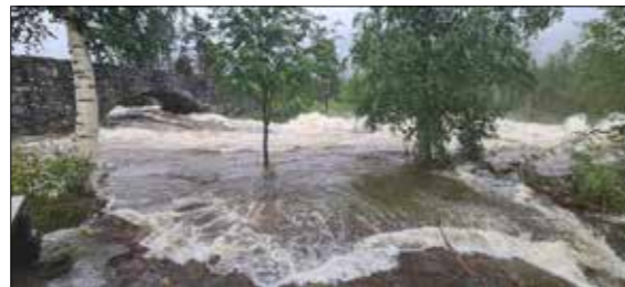
Etna gjekk høg og stri ved Lundebrue.