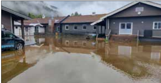
Slik såg det ut på Etnedal skule få dagar før skulestart.