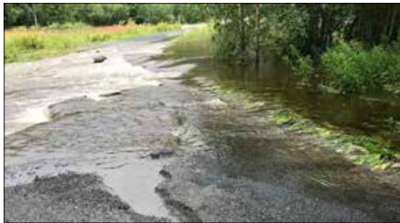
Elvevatnet fløynde over i Sør-Etnedal og tok med seg delar av Madslangrudvegen.

I skrivande stund er vegen endå stengt frå brua ved Etna familiecamping og over til Mosletta.