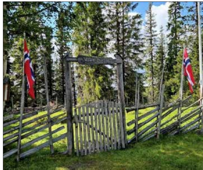
Kyrkjesletta på Dalen - Porten inn til Kyrkjesletta var pynta med norske flagg ein fredeleg plett på jorda.