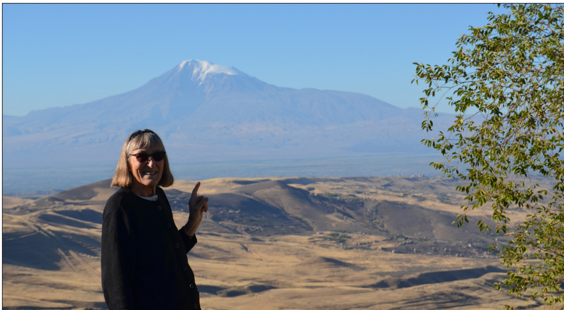
Araratfjellet, der Noas Ark stranda, var flott synleg frå Armenia, der det låg før. Men i 1921 gav Sovjetunionen det til Tyrkia. Framleis er det eit nasjonalsymbol i Armenia.