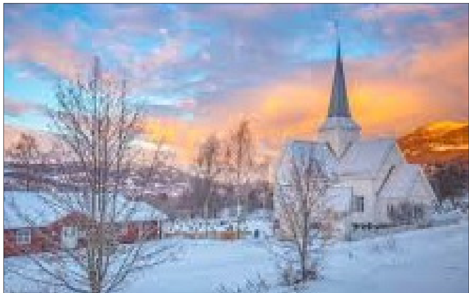
Tradisjon med kyrkjegang på julaften. Aurdal kirke.

Ho minnest at storfamilien feira jula saman i Hedalen i oppveksten. Det var høgtid, nærheit og familie, teiknefilmar og Sølvguttene. Rakafisken vart servert om formiddagen, med ”god og sterk lukt”!