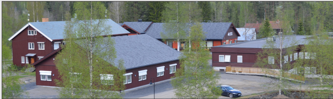
Nye helsehuset, sett frå tårnet i Bruflat kyrkje.

19. mars var ein merkedag for helsetenesta i kommunen vår, det var offisiell opning av det nye helsehuset på Bruflat. Legane, legesekretærene og helsesystemtenesta har no fått gode og tenlege lokale, med eigen ambulanseinngang.