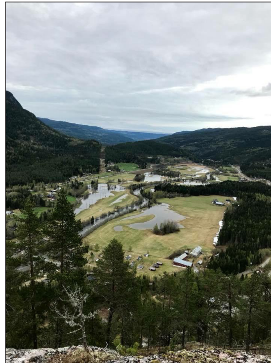
Flomstor Etna i Sør-Etnedal