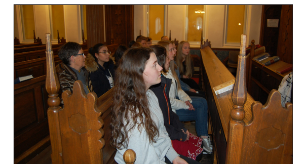
Konfirmantane fylgde nøye med.