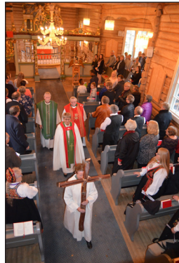
Frå visitasgudstenesta i Bruflat kyrkje 24. september.

Nyleg var det eit møte med gjennomgang av kva som er gjort og/eller planlagt å jobbe med vidare.