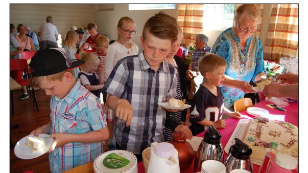
Jubileumskaka kom på bordet ei stund etter at rummegrauten og pølsene var fortært