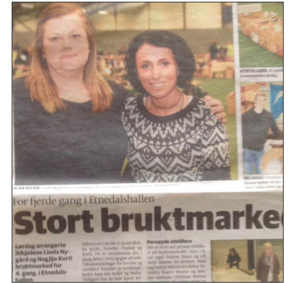
Faksimale frå avisa Valdres.