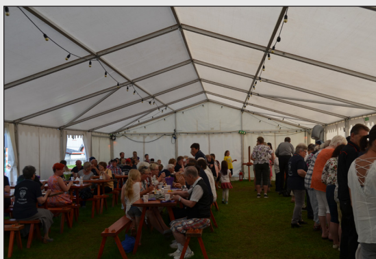
Mange fann vegen til teltet på Internasjonal dag