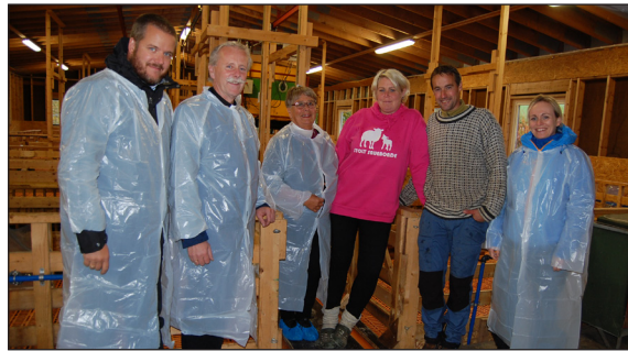
Frå gardsbesøket i Øvre Fauske.

Gudstenestetilbodet. Å sjå nærare på kvart sokn sitt lokale årshjul, og om gudsteneste-tilbodet svarar til behov i befolkning og samfunnsniv.