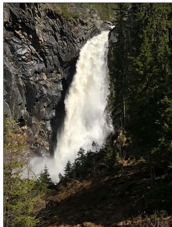
Juvfossen med stor vannføring