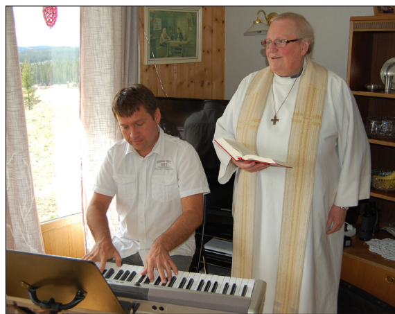
Serhiy organist og Marit prest

50 Så førte han dei ut mot Betania, og han lyfte hendene og velsigna dei. 51 Og medan han velsigna dei, skildest han frå dei og vart teken opp til himmelen. 52 Då fall dei på kne og tilbad han. Så gjekk dei tilbake til Jerusalem i stor glede. 53 Sidan var dei stadig i tempelet og lova og prisja Gud.