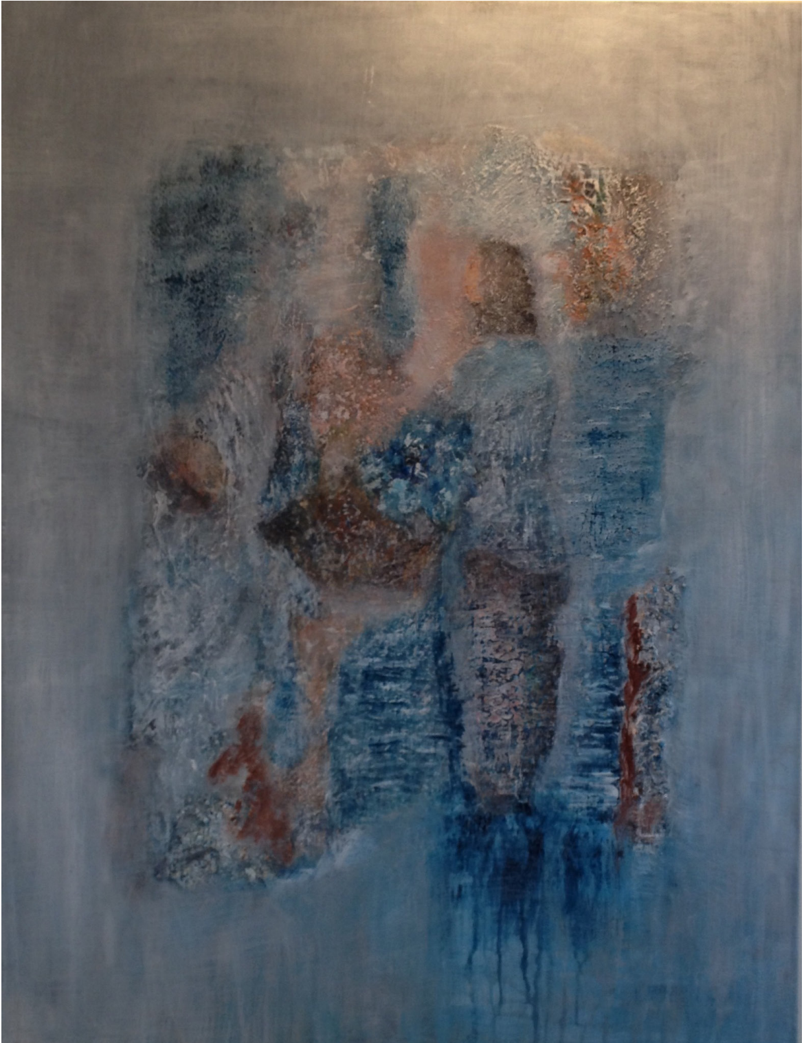
Maleri av Turid Fossen Nysveen : «Døpefont»