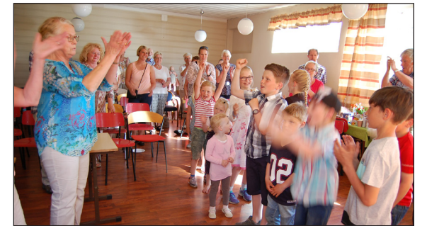
Juniorgjengen gleda oss alle med sang