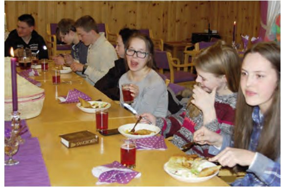
Frå fasteaksjonskvelden på Menighetshuset