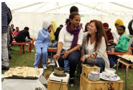
Afrikansk kaffesermoni på 5-årsjubileet

Nå har jeg vært 9 måneder i Etnedal som diakon og har hatt gleden av å bli kjent med mange av dere som bor her. Jeg har ruslet rundt og hilst på folk på butikken, på Annas kafe, på tunet, i kirka, på mottaket, på Etnedalsheimen, i kommunehuset, på servicetorget, på Kirkvoll, dagsenteret og Nærmiljøsentralen mm. Jeg har blitt møtt på en positiv og inkluderende måte i mange av kommunens etater, og det godt å se mye av det flotte som gjøres her av mange ildsjeler, lag og foreninger. Jeg har møtt mange trivelige folk og fått del i noens liv på godt og vondt. Jeg har