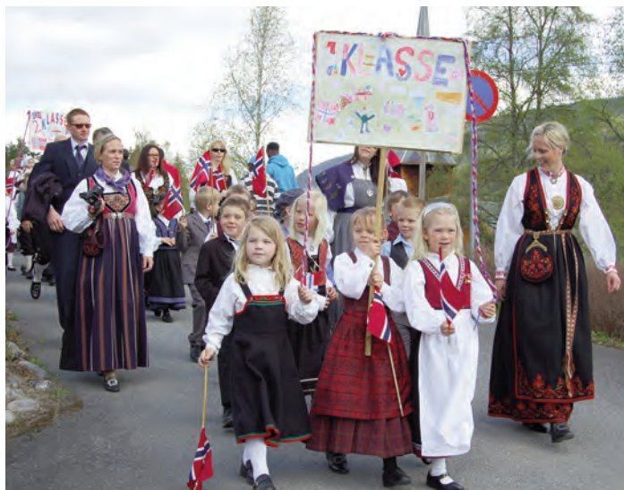
Det var stor oppslutning om 17. mai – toget i år, her er 1. klasse ved Etnedal skule