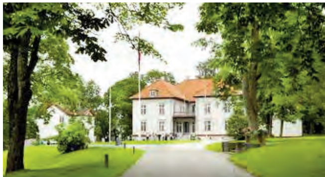
Eidsvollsbygningen, arena for bygging av eit nytt Noreg gjennom arbeidet til riksforsamlinga i 1814