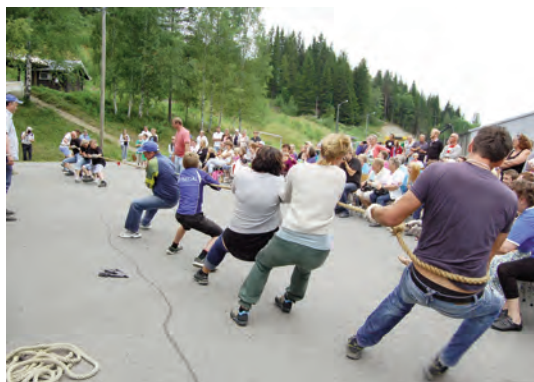
Krinstevling i tautrekking. Harde tak for aktørane, og publikum fylgjer spent med.