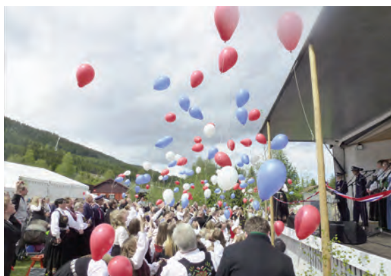
Jubileumsmarkering med «ballongslepp» i nasjonale fargar