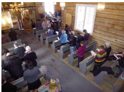
Utsnitt av ei syngande forsamling