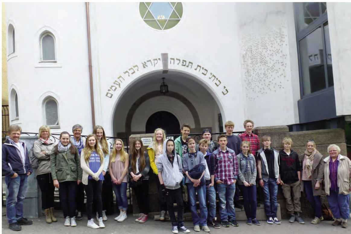
Alle samla utanfor den jødiske synagogen