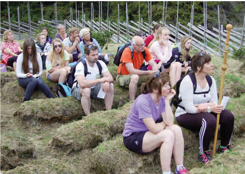
Kristi himmelfartsdag vandra konfirmantane, foreldre og fleire andre frå Kyrkjesletta på Dalen til N. Etnedal kyrkje. Samling på Kyrkjesletta før vandra