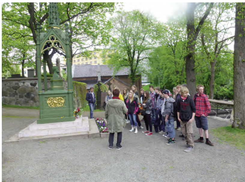
Ved Henrik Wergeland si grav på Vår Frelzers gravlund