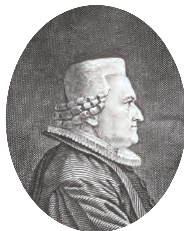
Johan Nordahl Brun skrev pinsesalmen «Ånd over ånder, kom ned fra det høye» i 1786.