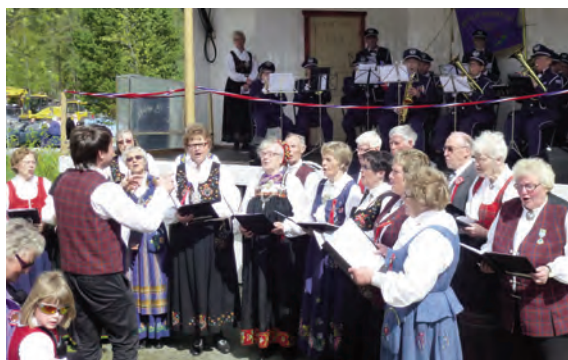
Bruflat musikklag og Bruflat sangkor framførte «Det går eit festtog gjennom landet», vinnarsangen i ei stor skrivekonkurranse utlyst av Stortinget i høve Grunnlovsjubiléet. (Tekst: Grethe Myhre Skottene. Melodi: Carl-Andreas Næss, begge frå Sarpsborg)