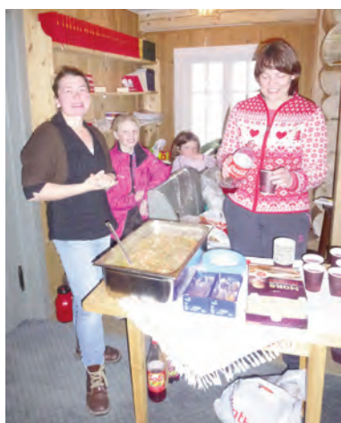
Soknerådet serverte velsmakande lapskaus