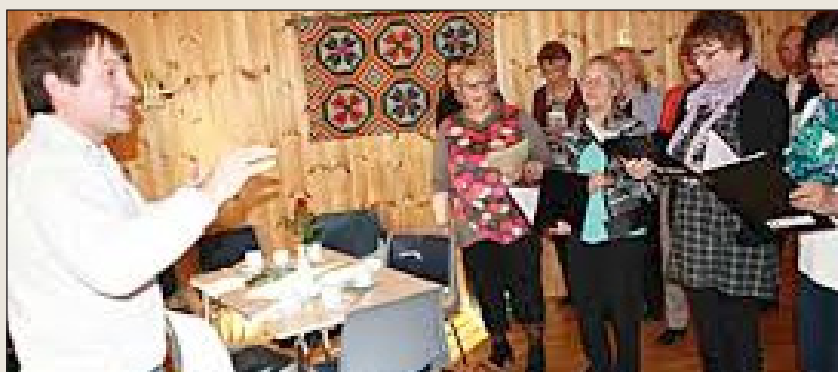
Frå sangkveld i Aurdal ; Bruflat sangkor