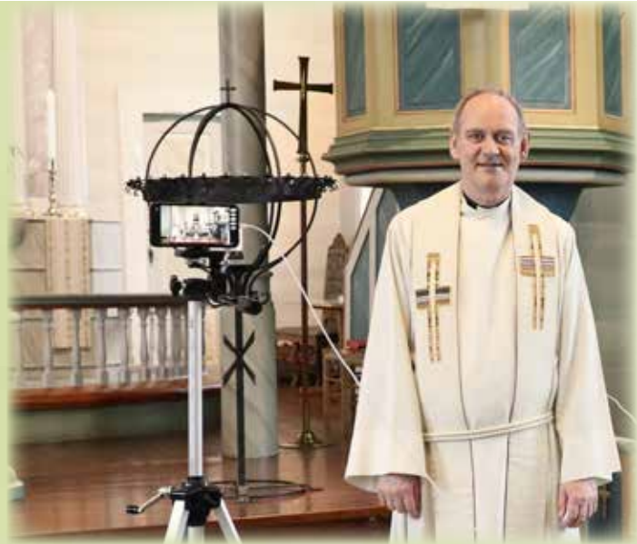
Det har blitt mange digitale gudstenester frå våren 2020.

Han opplevde det veldig godt å koma tilbake. Her var han kjend, her var heimen deira, og han trong ikkje nokon tilvenningsperiode. Det har vore ei veldig fin tid, og han opplevde at han vart teken imot med opne armar. Han har levd saman med bygdefolket i glede og sorg.