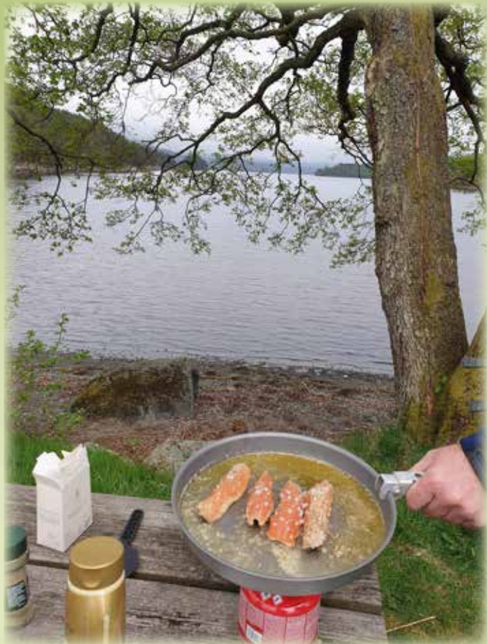
Idyllisk i Breiavikjo ved Storavatnet

Takk for ein kjekk ettermiddag ved Storavatnet. Takk til alle som var med og gjorde dagen kjekk; barn, ungdommar og vaksne <3.