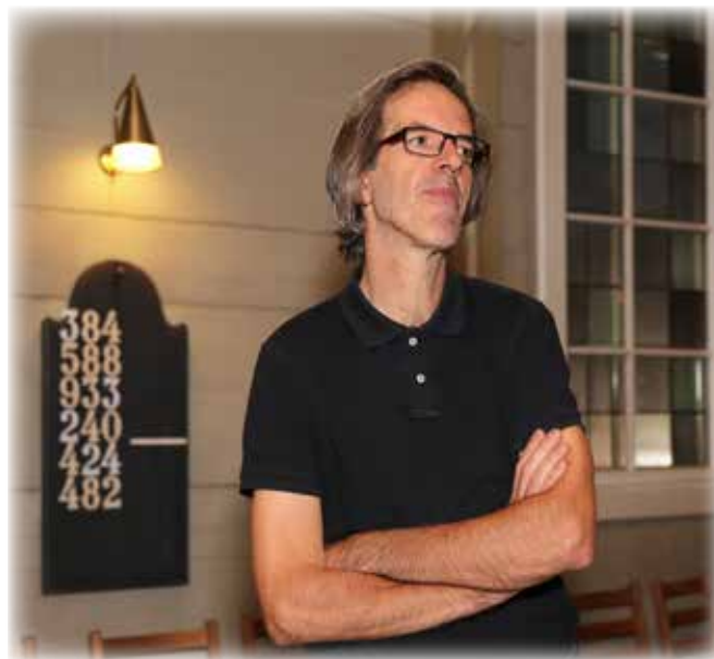
Arkivfoto: Torbjørn Hovland

Det er tungvint å dela seg på to stader slik det har vore til no, og det vert gjerne til at fridagen i veka vert brukt for å få alt til å gå opp. Det er viktig for han å gjera ein god jobb begge stader. Difor er det ei god løysing for Jan å få heil stilling i Fitjar for fire år.