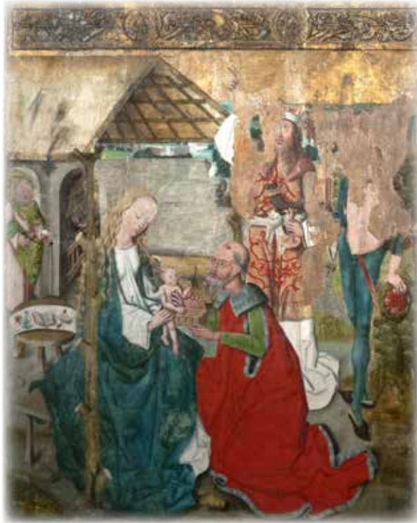
Utsnitt av alterskapet i Mariakirken i Bergen

Skal vi forstå at Gud er til stades i vår tid, må vi våge å male Jesus inn i vår kontekst og i våre liv. Kvar trur du Gud ville plassert Jesu krybbe dersom han skulle blitt fødd i dag? Kanskje ville han blitt fødd på eit asylmottak med ei einsleg mor? Biletet vi har frå stallen i Betlehem lyg ikkje. Dei vise mennene fann ikkje Jesus hos kong Herodes, eller mellom dei lærde i tempelet i Jerusalem, men i ein stall der det lukta sveitte og møk. Denne konteksten betyr noko fordi Gud valde den heilt medvite. Når Gud blir fødd inn i vår verd, blir han svak. Han blir utlevert. Han blir sårbar, overgitt til ei fattig kvinne. Det gjer han fordi han elsker oss. Han gjer det for å vise oss kva kjærleik er. Kjærleiken kan ikkje kreve, den kan berre komma oss i møte og sei: Sjå her har eg kome deg så nær som eg kan for å vise deg min kjærleik. Gud viser sin solidaritet med oss nettopp ved å velje å bli fødd i eit folk som var forfølgde. Gud kjem til oss der vi er og blir ein av oss, kledd som ein av oss. Også i dag er han vår bror. Han er i lidinga når menneske lir. Han græt når vi sørgjer. Han ler når vi er glade. Han vil la seg finne i vår verd når vi søker han.