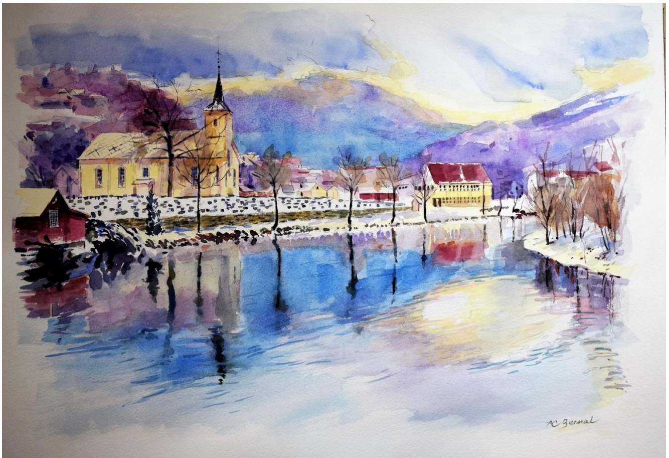
Framsdebilete: Dale kyrkje, måleri av Antonio Bernal (av fotografi teke av Joy Taylor).