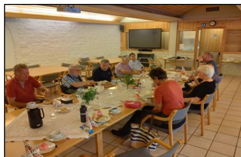
Da hører også bordfellesskap med.