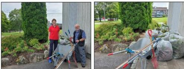
Et viktig mål er å kombinere nytte med hygge.