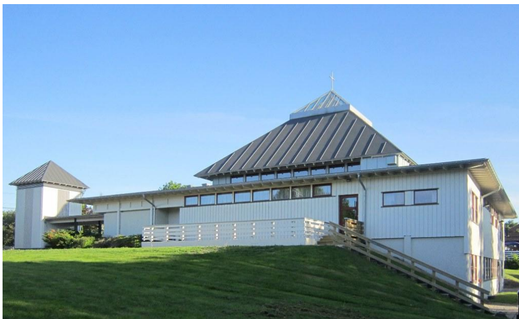
Kjølstad kirke ble tegnet av Aksel Fronth og oppført i 1982–86. Innviesen var 7. september 1986. Kirken feirer 40 årsjubileum i 2026.

Det fremheves at Kjølstad kirke har stor utleieaktivitet. Lions Club Borge har fast leieavtale i denne kirken.