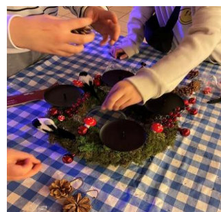
Juleaktivitet på Klubben en fredag i november 2025

Barna hadde i 2025 et stort ønske om at vi kunne få til en liten e-sportavdeling og forslagene på spill var mange og interessen er stor. Vi prøver å jobbe videre med å få midler til dette selv om vi har E4A på Kirkens hus. For våre barn er det å dra til byen noe ikke foreldrene ønsker, noe som er veldig forståelig.