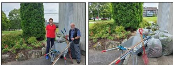
Et viktig mål er å kombinere nytte med hygge.