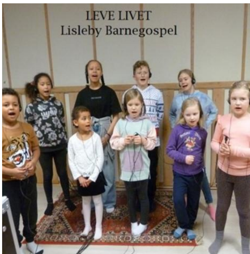
Lisleby barnegospel gjestet Høstdagene i 2025.