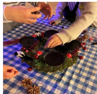
Juleaktivitet på Klubben en fredag i november 2025

Klubben er besøkt av ca. 135 ulike barn i løpet av året og har et gjennomsnitt på rundt 30 barn hver gang, noe som krever en del ressurser i forhold til frivillige samt innkjøp og arbeid med å kunne skaffe ulike ting som nye spill o.l..