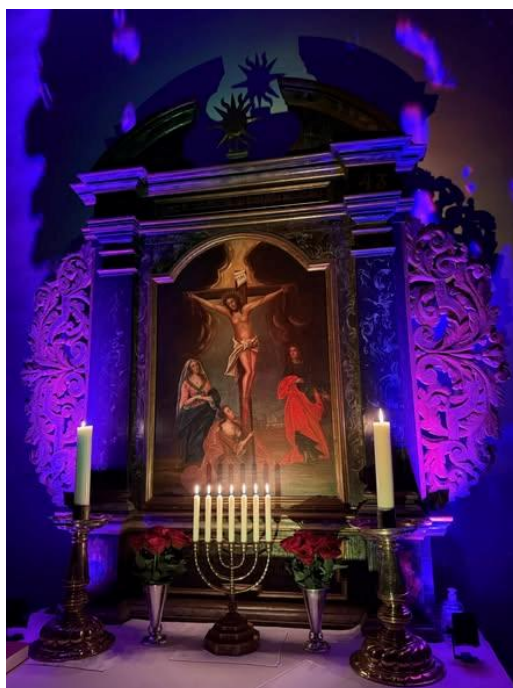
Desember 2025 i Borge kirke