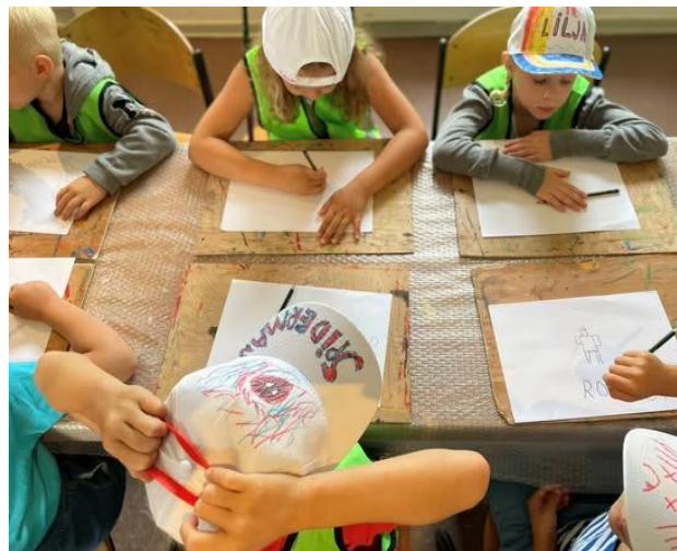
«To dager til» – et populært tilbud.

Den andre dagen var vi på Kjølstad. Her hadde vi fullt av ulike oppgaver og en rolig dag. Få voksne legger begrensninger på man kunne gjøre. Fra Borge var det 14 (av i alt 22) barn påmeldt, noe som viser at dette er et kjærkomment tilbud. «To dager til» krever en del planlegging og en del voksne. Her er det ønskelig at frivillige stiller opp. Neste gang er vi nødt til å være flere voksne ellers må vi mest sannsynlig justere ned til 1 dag, noe som er trist.