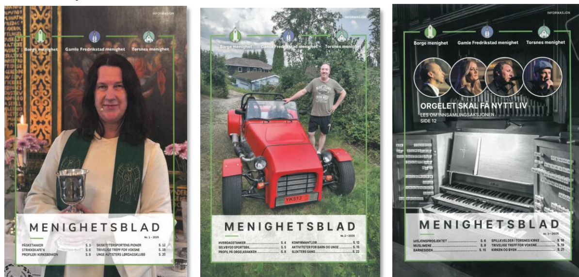
Utgave 1, 2 og 3 i 2025

Nye personvernkrav gjør at navn på døpte og viede ikke lenger kan publiseres uten skriftlig samtykke, og bortfallet av den faste avisannonsen i Fredrikstad Blad gir menighetsbladet en enda viktigere rolle i kommunikasjonen framover.