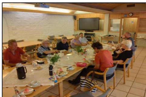
Da hører også bordfellesskap med.