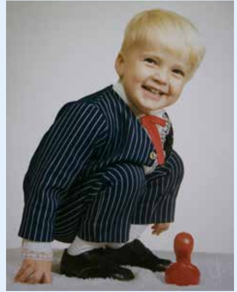
- Jeg glemmer ikke da vi hentet Oscar.

sjonskontoret i første omgang nei. Det ble til slutt et ja.