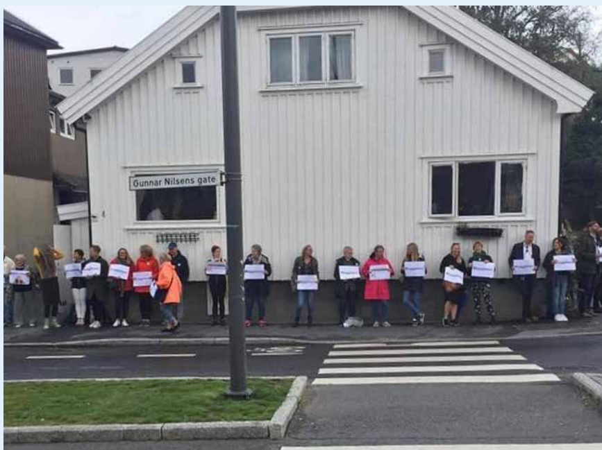
Dialogforum tok initiativ til en bønnering rundt Masjid Darussalam-moskéen i Gunnar Nilsens gate 4, under motto "Trygg bønn", i september 2019.