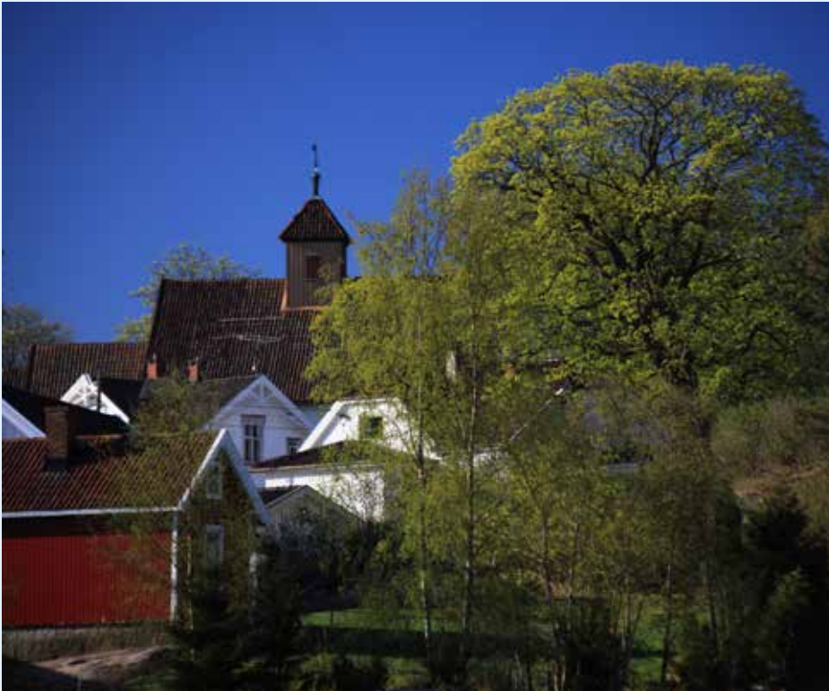
Gamle Glemmen kirke er omgitt av gårdstun og bebyggelse fra slutten av 1800-tallet. I forkant et enormt eketre, med stammeomkrets på seks meter.