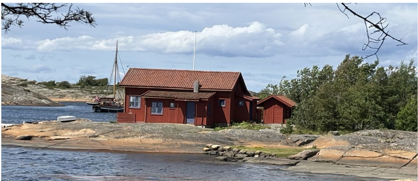
Capri i dag.