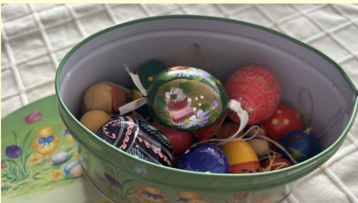
Mine påskeegg til dekorasjon på løv eller trollhassel.

I kirkelig sammenheng er lilla den dominerende fargen fram til det skifter til hvitt 1.påskedag. Den lilla fargen symboliserer sorg og bot, men den hvite fargen er fest- og gledes fargen.