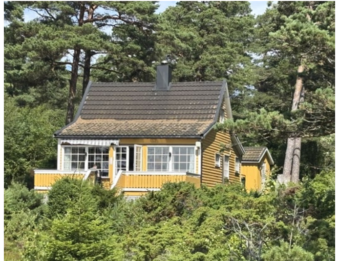
Dette skal være den opprinnelige Kråkerøyhytta.

Flere av de såkalte bevaringsverdige Kråkerøyhyttene ligger her. I dette området lå også formannshytta som formenn i området kunne leie til seg og sine familier om sommeren.