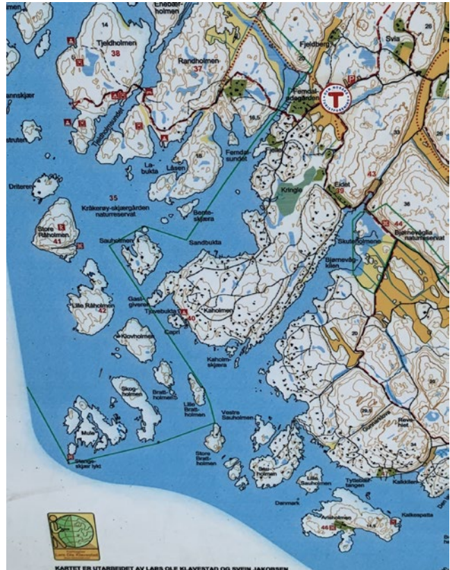
Kart over området

Med dette som utgangspunkt går vi sørøstover mot Bjørnevågakilen og tar så til høyre/ sørøver ved den vesle bebyggelsen på venstre side. Turen går så videre gjennom stien ved hyttebebyggelsen på holmen.