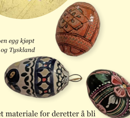
Her er noen egg kjøpt i Ungarn og Tyskland

som et egg av annet materiale for deretter å bli nydelig malt i intrikate mønster og farger.