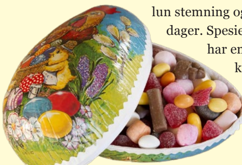
Et påskeegg fylt med sjokolade og marsipan og annet godteri er noe de fleste barn håper på i påska. (Barnas påskedrom fra Wikipedia)

har en lang tradisjon på kunstneriske dekorering av egg. Noen av disse er imidlertid laget