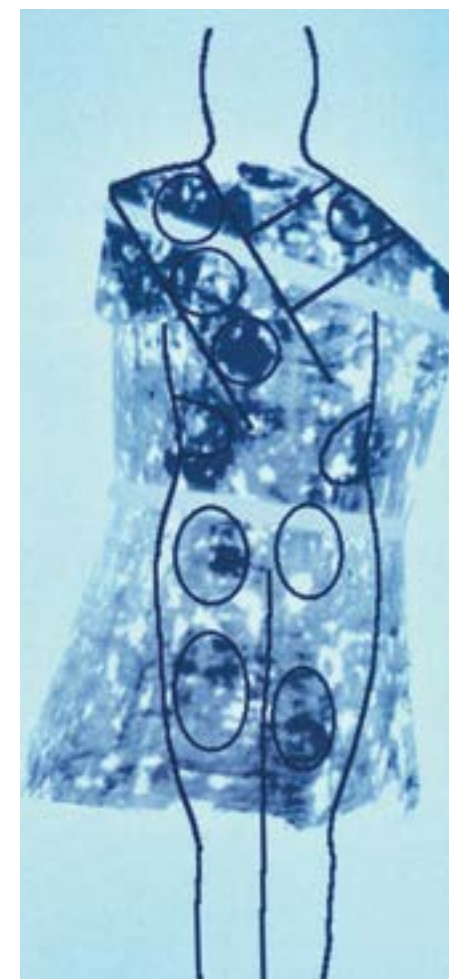
Tegning av Kjortelen i Argenteuil på en modell. Den skal stilles ut i Paris våren 2016, for første gang siden 1984. Blodflekkene på ryggen er markert med ringer og har samme form som på Likkledet i Torino. Forskere konkluderer med at de er flekket til av samme mann. Blodtype og pollenarter på begge stemmer overens. På begge kleder kan en se at mannen har båret noe tungt over skulderen (tverrstokken til korset?)

fins i Israel. Disse fins også på de to andre kledene. Derfor kan vi si med stor sannsynlighet: På ett tidspunkt har alle tre befunnet seg i Det hellige land, de bekrefter hverandre gjensidig.