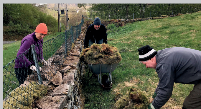
Fjerning av mose på den gamle muren kring Holdhus kyrkje og gravplassen.