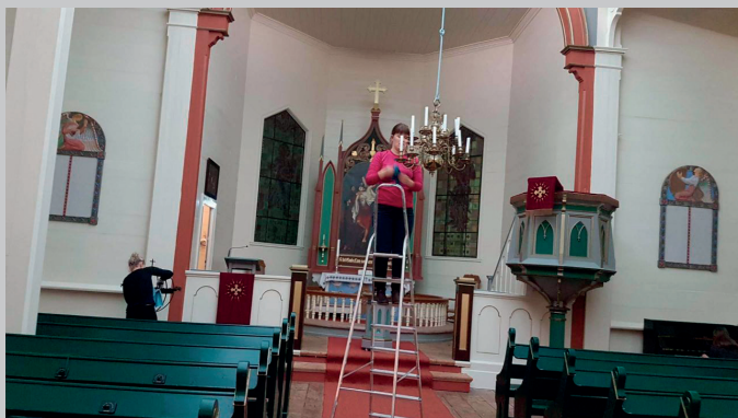
Dugnad i Strandvik kyrkje. Den gamle lysekruna vert reingjort med varsemid – og det same med lysgloben i bakgrunnen.