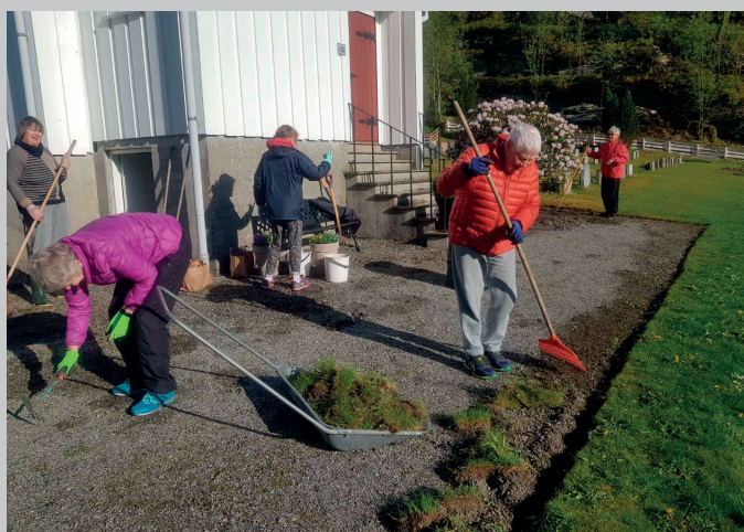
Stor innsats med grusgangen ved Sævareid kapell.