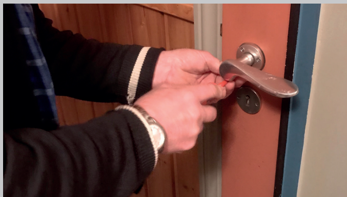
Lause handtak vert festa!