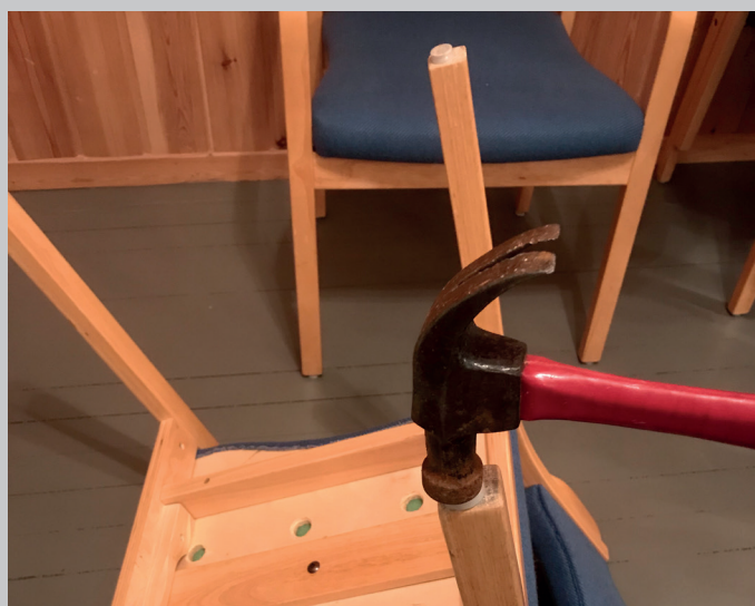
Nye knottar på stolane må til med jamne mellomrom.