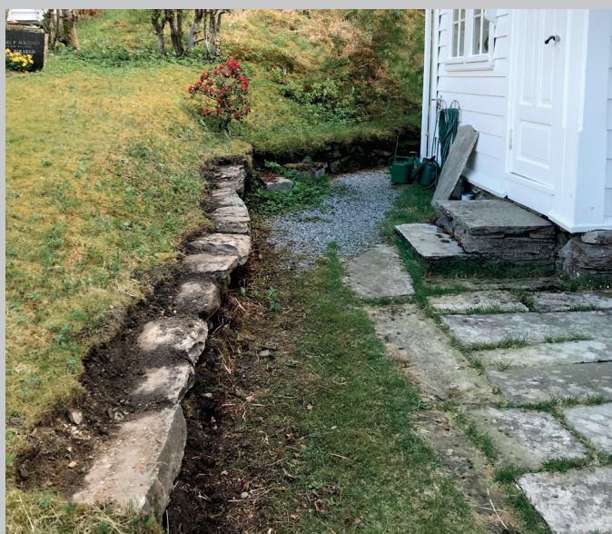
Her har ein gamal steinmur ved Hålandsdalen kyrkje fått sjå dagens lys att - etter at torv og mose er fjerna.