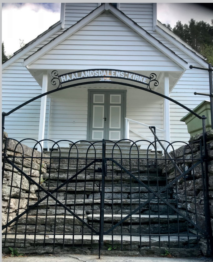
Porten i Hålandsdalen er mala og skin så fint att!