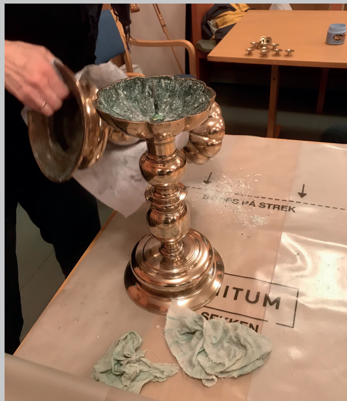
Kyrkjesølvet vart þussa i dei alle fleste kyrkjene.