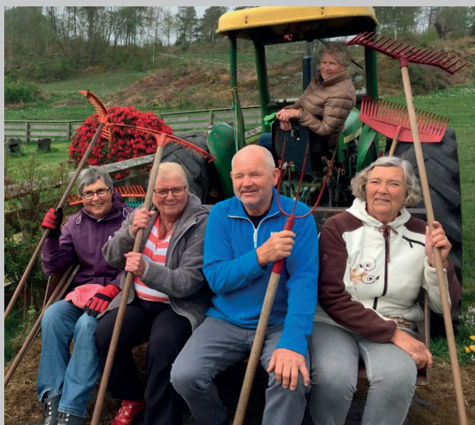
Her er delar av dugnadsgjengen på Hjartnes gravplass.