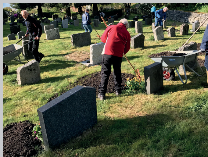
Påfyll av jord på den gamle gravplassen på Fusa.