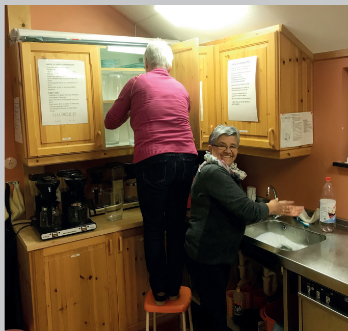
Storreingjering på kjøkkenet i Fusa kyrkje.