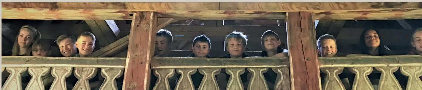
Ungdomen samlast på galleriet, slik det var tenkt på 1700-talet då det vart bygd. Her har Vinnes friskule tatt plass, ...

For 300 år sidan kunne du blir bøtelagd dersom du ikkje kom til kyrkjes, og bestod du ikkje utspørjinga til konfirmasjonen, kunne du bli nekta å gifta deg. Kyrkja var ikkje noko du kunne velja vekk; ho følgde deg gjennom livet frå fyrste til siste pust og vel så det. Difor er dei gamle kyrkjene del av historia til alle i Noregs rike, ikkje berre til dei som i dag kallar seg kristne, og difor er skuleelevar dei to siste forsomrane blitt inviterte til å tre inn i Holdhus kyrkje, slik forfedrane og formødrene til somme av dei gjorde så titt i si tid.