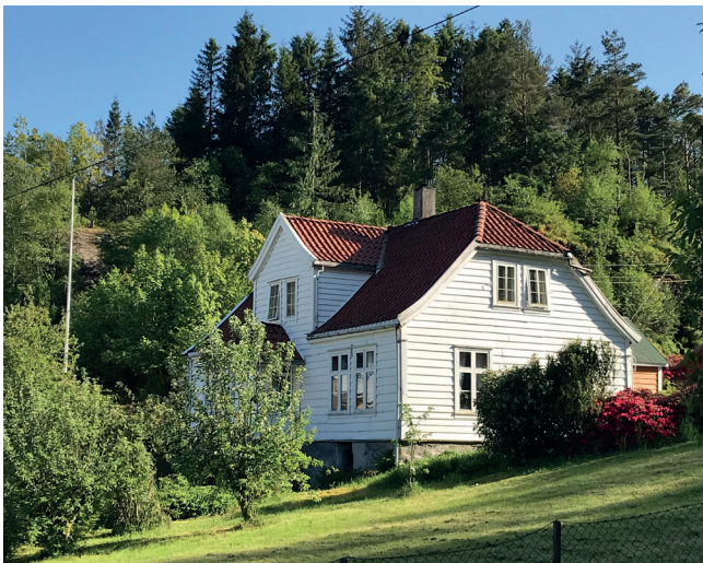
Våningshuset på Haugen gard i Sævareid sentrum.