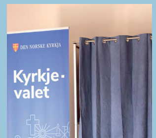
Kyrkjevalet 2023 S.10