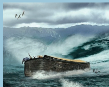
Noahs ark S. 6