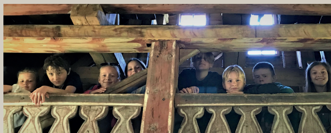
og her Eiklandsosen og Ådlandsfjorden skular.