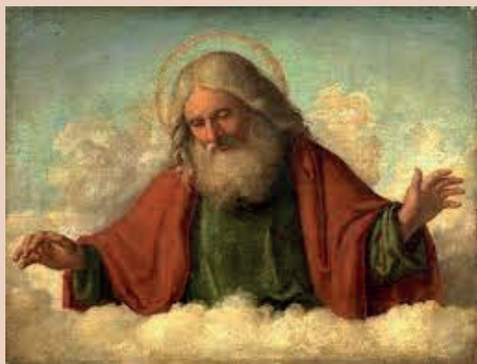
God the Father, maleri av Cima da Conegliano (c.1460 - c.1517)

Det er visst ingen som har sett Gud, Moses skal riktig nok ha sett han da han åpenbarte seg for han i et tre. Eller rettere sagt i en brennende tornebusk. På den måten var det Moses ble lederen av det israelske folk.