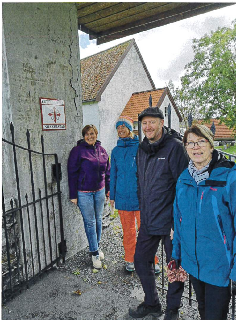
Pilegrimstur på Giske