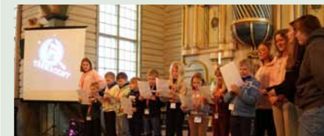
Tårnagentene opptrer på gudstjenesten i Vardal kirke.

Kristenretten (1024) og Magnus Lagabøtes landslov (1274) ga oss en human lovgivning. Det ble forbudt med blodhevn, tvangsgifte og å sette ut barn med misdannelser. Kong Magnus fikk innebygd en original passus om at loven måtte anvendes i pakt med de sentrale verdiene: sannhet, rettferdighet, fred og barmhjertighet . Kirka i middelalderen kalte disse verdiene for «Guds fire døtre». De var hentet direkte fra Bibelen: Miskunn og sannhet skal møte hverandre, rettferd og fred skal kysse hverandre. (Salme 85) Disse verdiene skulle være styrende for politikk og domsvesen. Hvilket strålende bidrag til politikken! Og ikke akkurat mindre aktuelle.