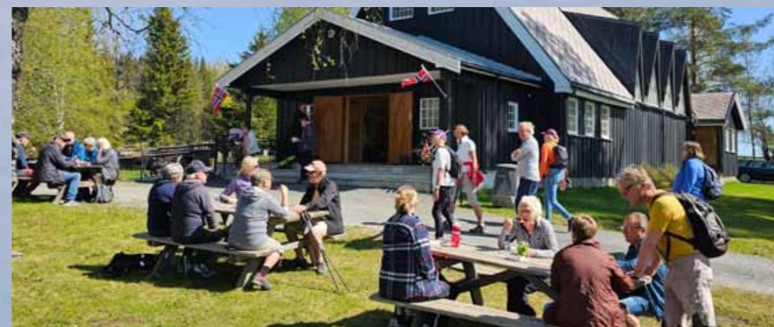
Kristi Himmelfartsdag 29.mai. Pilgrimsvandring fra Gjøvik kirke kl 09.00. Servering ved Bråstad kirke og gudstjeneste kl 13.00. Bildet er fra 2023. Foto JD.