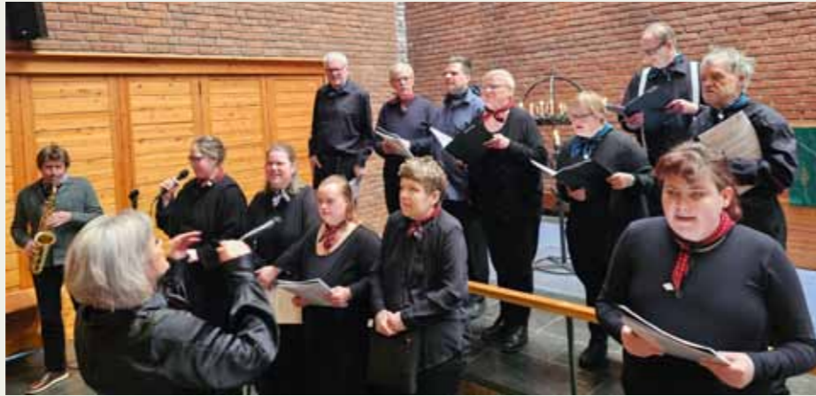
Koret Korpus har flotte sanger og formidler et viktig budskap om tro, håp og kjærlighet.

Søndag 16.februar deltok koret Korpus og Korpus scene i gudstjenesten i Hunn kirke. Det ble en flott fremføring av viktige tema rundt glede og fellesskap og sangene gikk rett til hjertet.