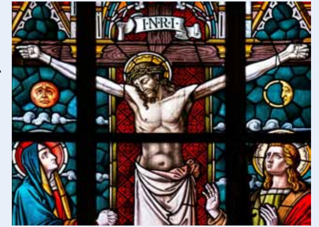
Johannespasjonens tekster er hentet direkte fra lidelseshistorien i bibelen.