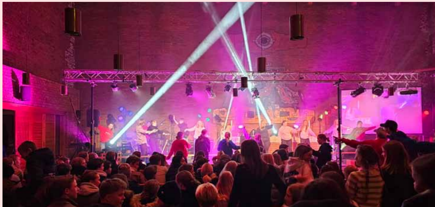
Konfirmantenes Kickoff i Hunn kirke 24.januar ble en stor suksess.