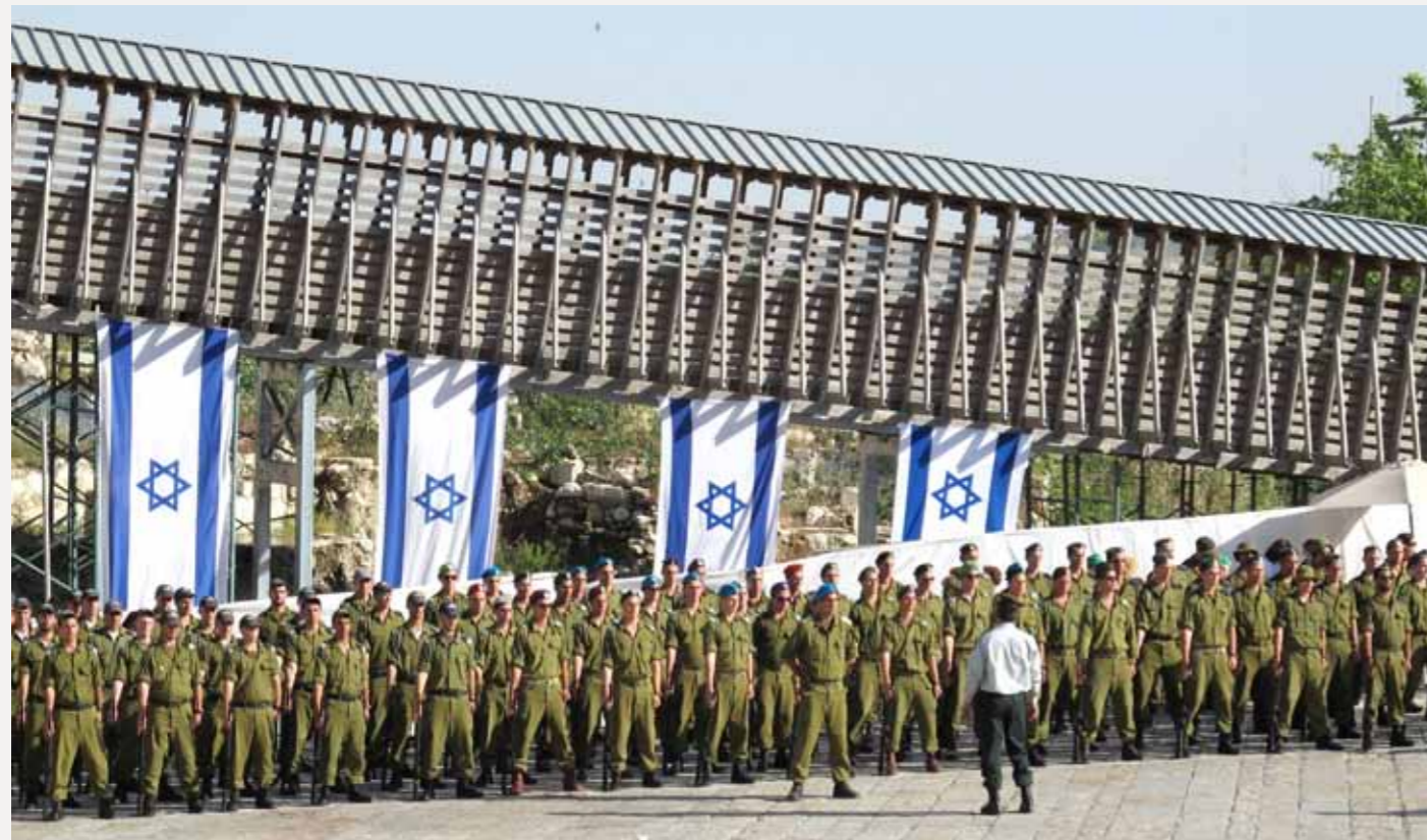
Det er ingen ting i Jesu forkynnelse som tyder på at staten Israel skulle være en oppfyllelse av Guds løfter om et land. Jesus sa at hans rike ikke var av denne verden. Staten Israel må bedømmes ut fra samme folkerettslige prinsipper som andre stater. Bildet er fra en militærparade i Jerusalem.