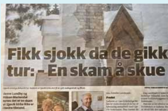
Faksimille av OA 28. januar 2025

Det er 11 kirker og kapeller i Gjøvik og