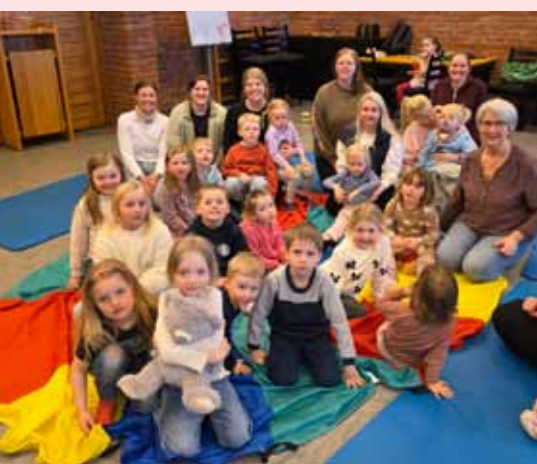
Superonsdag har blitt en hit for småbarnsfamilier.

For barnefamilier hver onsdag i skoleåret: Middag kl 16.45 (påmelding i appen Spond) og Familiesprell kl 17.30 (førskolealder)