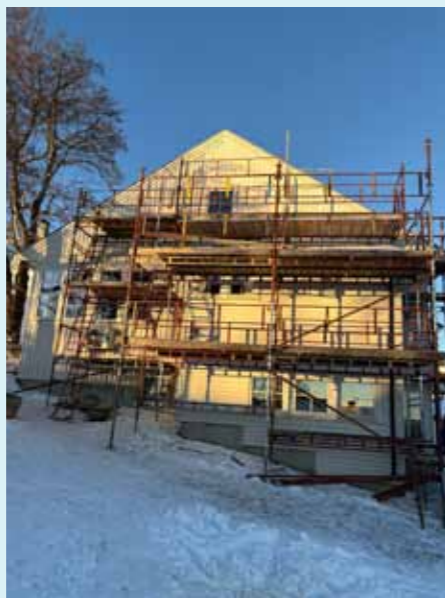
Vardal menighetshus pusses opp nå. Bidrag kan sendes på VIPPS 74491.

Vedlikeholdet blir finansiert med oppsparte midler, og vi er helt avhengig av ga-