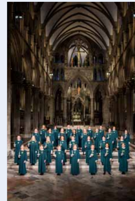
Det blir storfint besøk i Gjøvik kirke lørdag 31.mai. Nidarosdomens jentekor gir en halvtimes gratiskonsert.