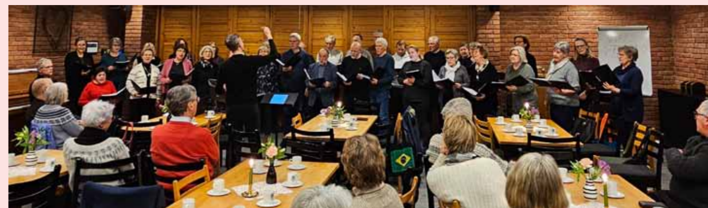
Fredheim blandede kor var med på allsangkvelden i Hunn kirke 18. februar.

kaféer, butikker, torgscene, lederkro, samtalefelt, tro- og livsynstelt". I Leirkirken blir det morgen- og kveldsbønn og noen korte nattverd-gudstjenester. Kunne du tenke deg å ta en to timers vakt som vertskap i leirkirka? Send tekstmelding til 915 31 830.