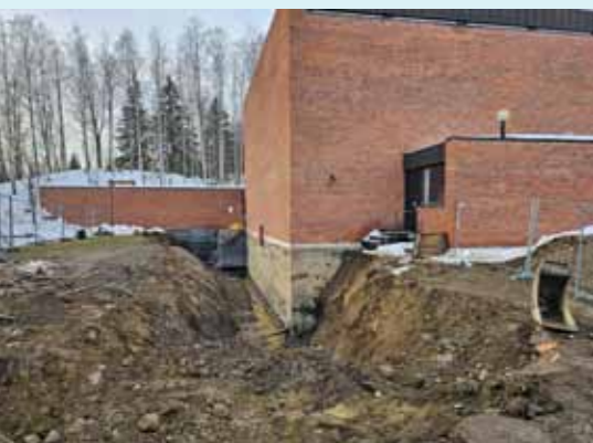
Tre meter under bakken måtte man for å finne rørene for vann og avløp.

Hunn kirke nærmer seg 60 år. Med det er også forventet levetid for kloakkrørene passert. Nå i vinter ble det akutt forstoppelse og kirkevergen så ingen annen løsning enn å engasjere Gjerdalen service til å grave opp de gamle vann og avløpsrørene og legge nye. Rørene ligger tre meter under bakken og det var mye masse som måtte flyttes. Jobben ble utført på profesjonelt vis. Men det skjedde i mildværsperioden i mars da det øverste laget var tinet søle og en meter med tele hindret at fuktigheten ble sugd opp. Folk med vitige tunger og sølete støvler kommenterte at Jesus gikk på vannet, mens dagens disipler går på sølehavet.