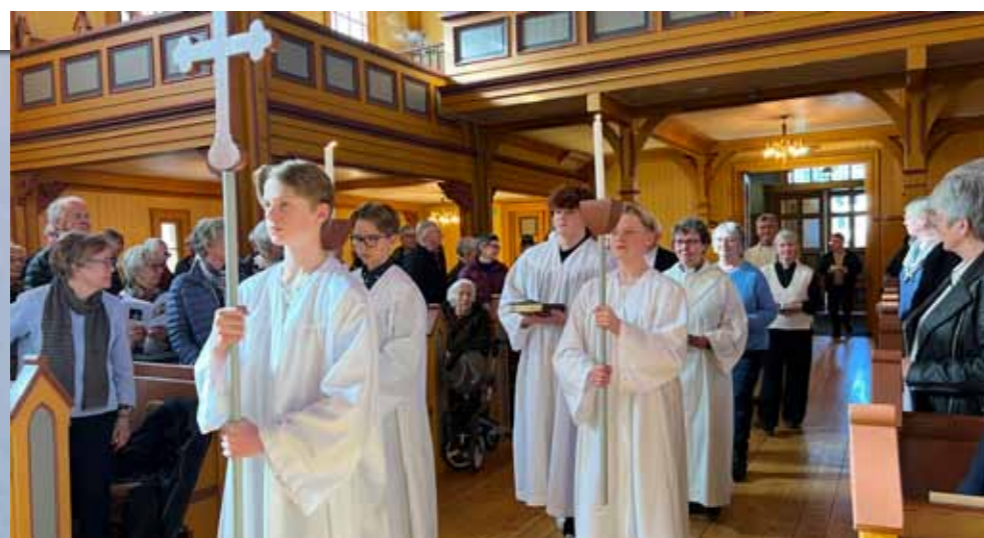
Fra gudstjenesten i Gjøvik kirke 23.mars som NRK overførte i radio og TV.