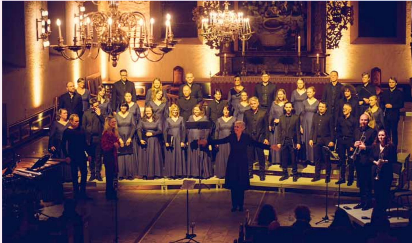
Oslo Domkor er en av Norges ledende formidlere av kirkemusikk.