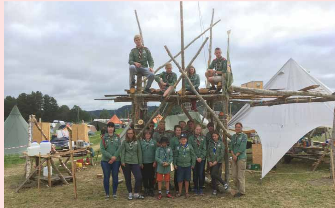
Det er stas for våre lokale speidere at årets landsleir blir på Vind. Her ser vi speidere fra Gjøvik, Lillehammer og Hadeland på landsleir på Stjørdal i 2018.