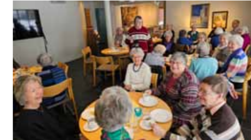
Hver måned er det formiddagstreff i Engehaugen kirke med et kulturelt program, andakt, sang, kaffe, god mat og sosialt samvær, her fra 21.februar 2025.

Onsdag 11. juni kl. 11.00-13.00. Ta med det du vil grille, vi spanderer drikke og salat.