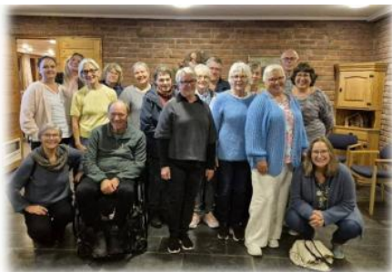
Fellesmøte diakoniutvalg i Hunn september 2025