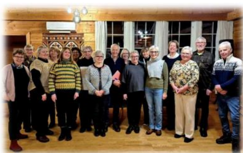
Fellesmøte diakoniutvalg i Vardal februar 2025

I løpet av året har menighetene revidert sine lokale diakoniplaner, og det er registrert økt aktivitet i flere sokn. Det ble også testet ut et arbeidsutvalg (AUDI) som har fungert godt som arena for samarbeid og prioritering.