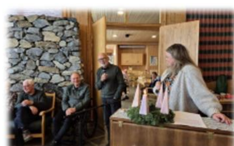
Formiddagstreff i Seegård kirke

Diakonene har gjennomført et bredt spekter av aktiviteter, blant annet over 180 samtaler, sorggrupper i samarbeid med kommunen, faste møteplasser som «Kom og spis», hobbygruppe og sangsamlinger, samt arrangementer knyttet til Allehelgen, 17. mai og Fasteaksjonen.