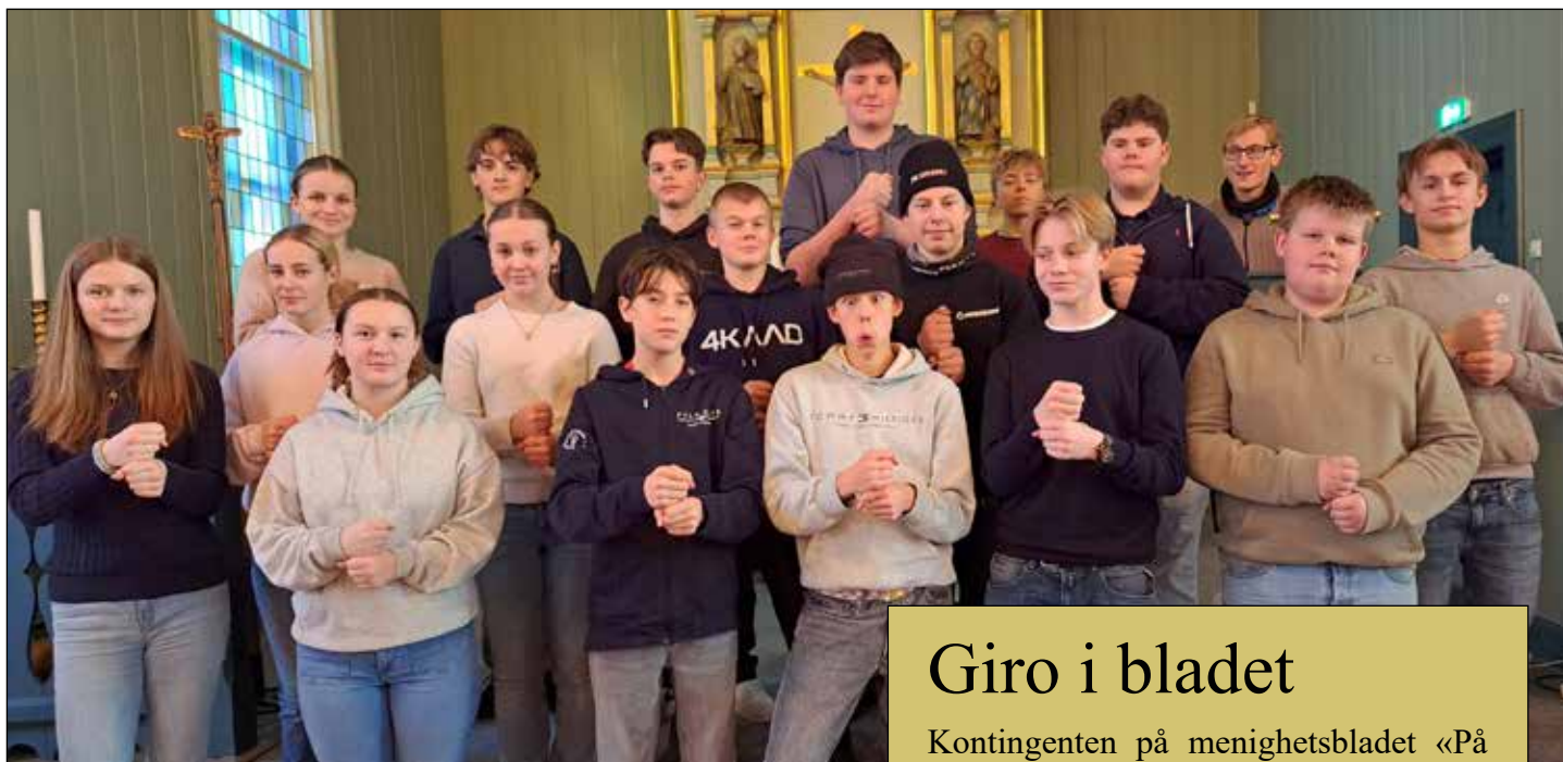
Her er gjengen som var med på Bli-kjent-samlinga i Nykirke i januar.