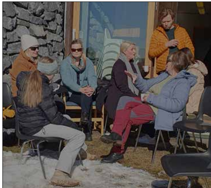
Mange benyttet anledningen til å snakke sammen