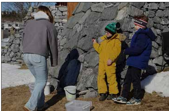
Ballkast var også en aktivitet