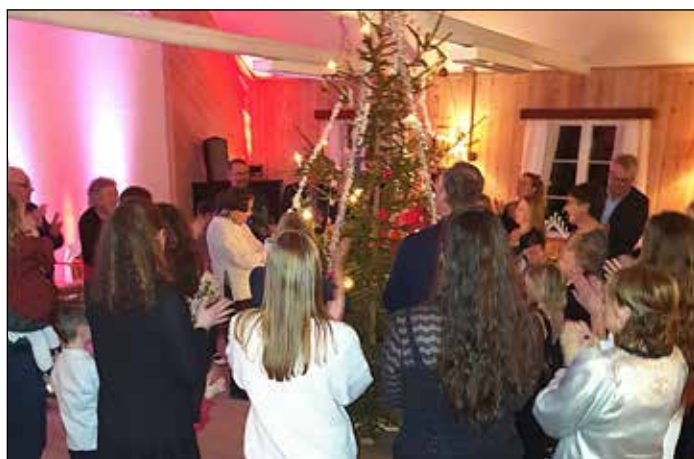
Tradisjonell julefest på Betel 3. juledag med fult hus og god stemning