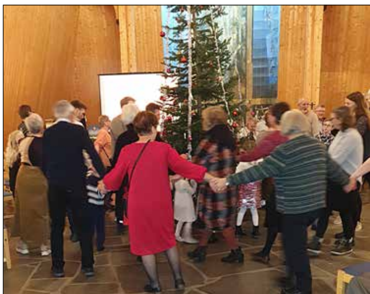
Mange deltok også på menighetens julefest i Seegård kirke