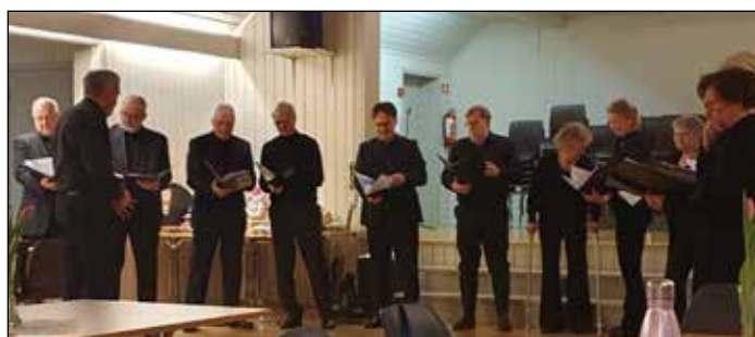
Den 14. januar var Nordsinni blandede kor på Lindheim for å syngje jula ut