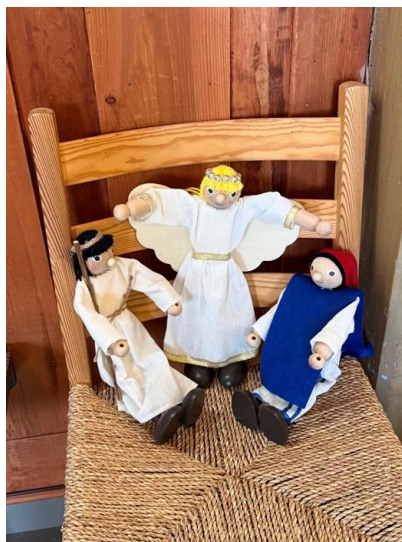
Dei tre figurane på stolen er Maria,