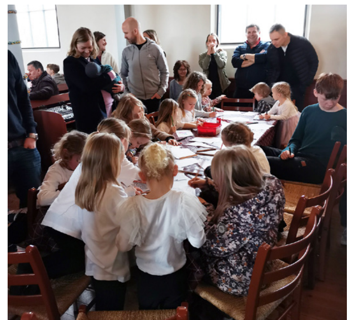
Stor aktivitet på tegnebordet.