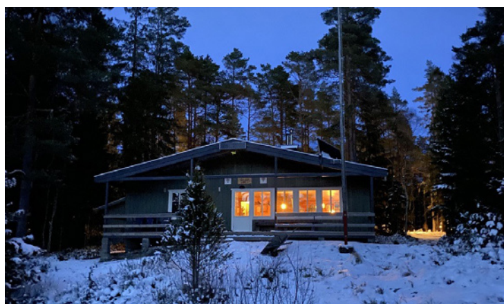
Bjørnlia speiderhytte ligger ved Erte.