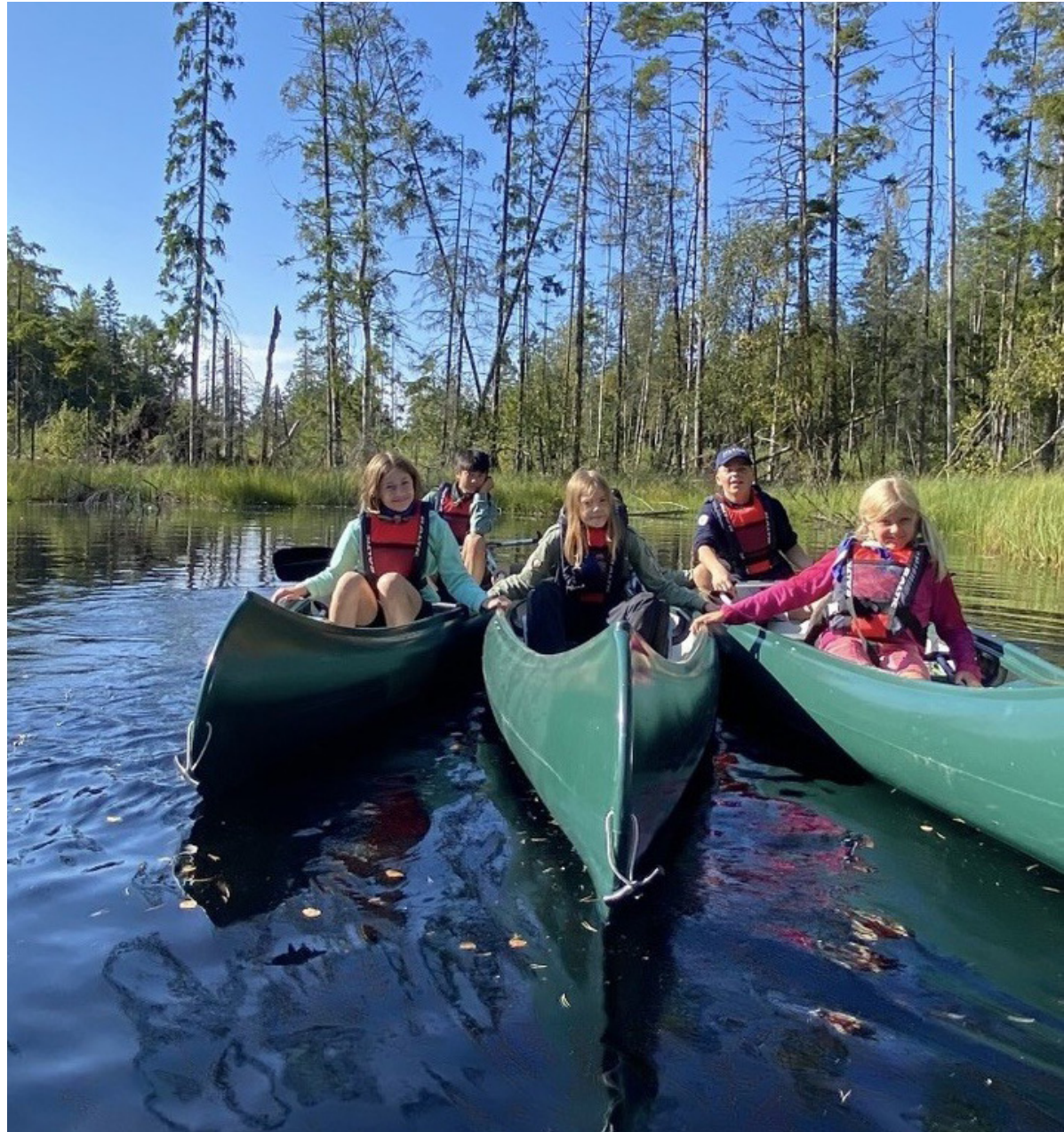
Friluftsliv er viktig for speiderne, som her er på kanotur.

I 2003 slo KFUK- og KFUM-speiderne seg sammen, og vi