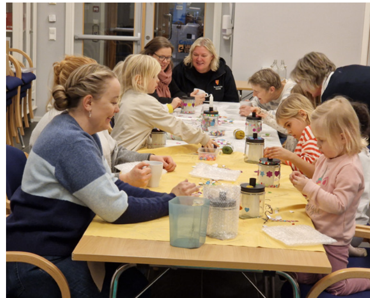
Ivrigt barn i aksjon. Alltid populært med formingsaktiviteter.