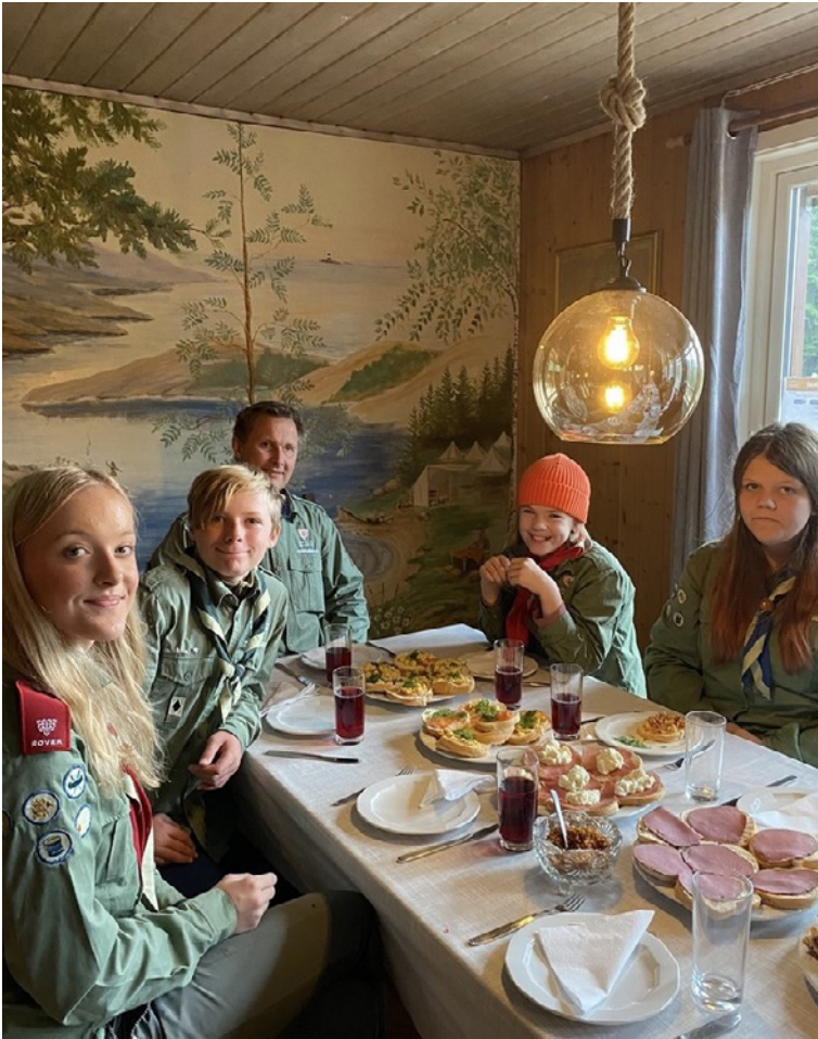
Både vanlige speider- og ledermøter holdes i speiderhytta på Bjørnlia. Vanligvis hver mandag.

I nesten 100 år har Halden KFUK-KFUM-speidere drevet speiderarbeid i Halden. Det er fremdeles full fart på hvert speidermøte.