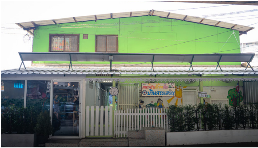
Bygningen som i dag er en barnehage, var tidligere en politistasjon.