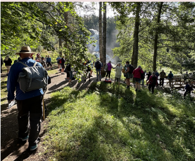
Vandringen starter ved vakre Elgåfossen. Bildet er fra en vandring på Borgleden i fjor sommer.

Søndag 15. juni inviterer Enningdalen menighet til pilegrimsvandring for pilegrimer i alle aldre.