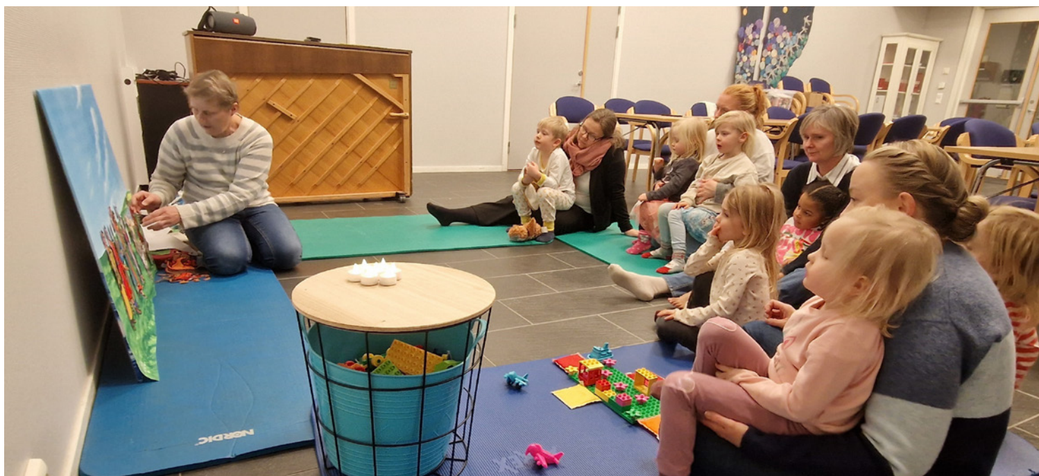
Familiesang begynner med sang og bibelfortelling.

Familiesang betyr jo at både foreldre og barn synger med, og vi har ikke ambisjoner om å opptre som et flott sangkor. Det er gleden i øyeblikket ved å synge, og læring og utvikling