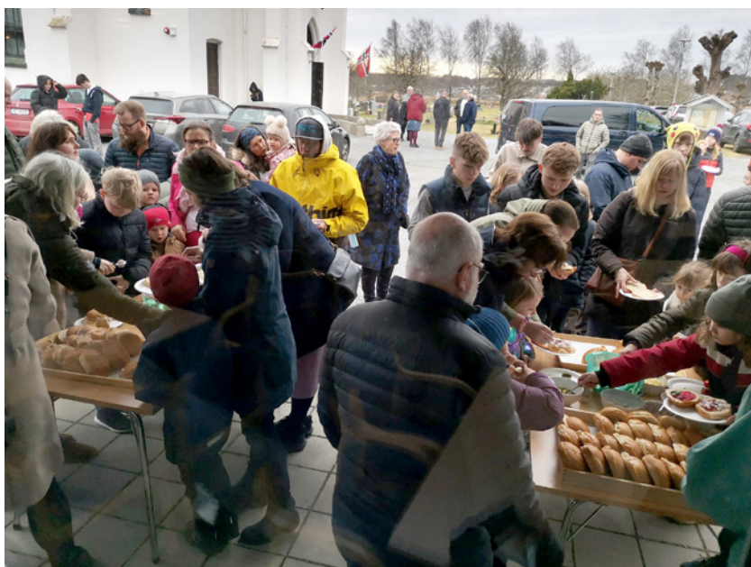
Det var kamp om bollene på bordet som var rigget på utsiden av kirken.