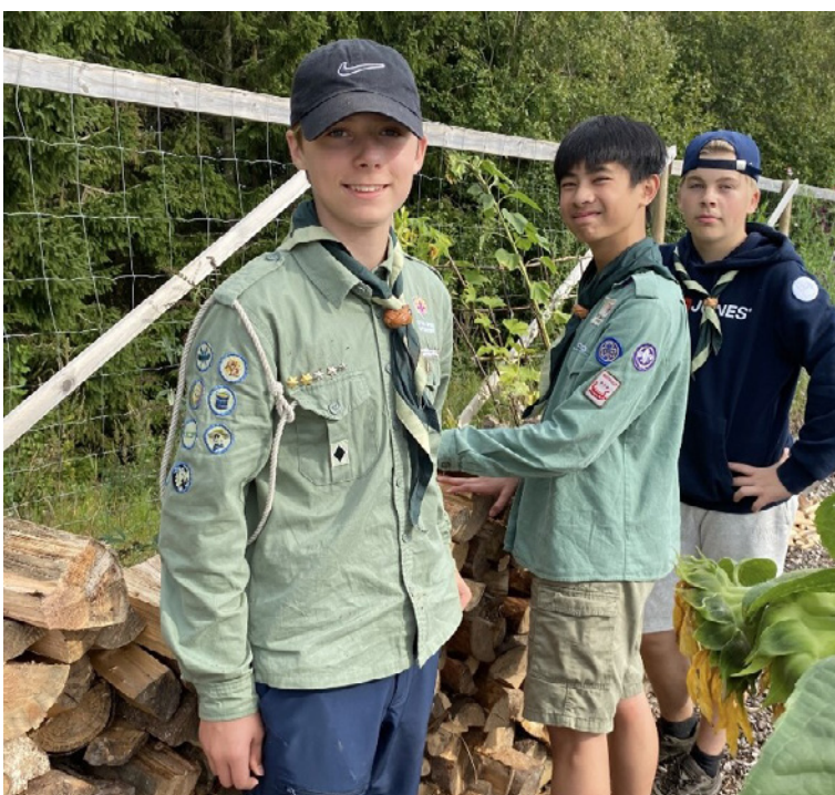
KFUK-KFUM-speiderne driver med mange forskjellige aktiviteter.

Epost: haldenkmspeider@gmail.com . Telefon 928 09 029