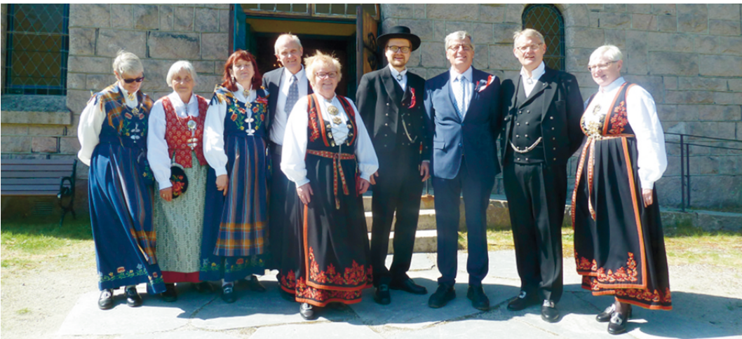
Her er ein ungdomsgjeng som er samla på kyrkjebakken til leik og moro 17. mai, og har hug til å koma i kyrkjebladet.

To av dei mange fine blyglasvindaugene i Kviteseid kyrkje er no totalrenoverte og sette på plass igjen. Blyet var i løpet av dei 100 åra som er gått sidan dei var nye, blitt svekka og dårleg. No er alt blyet i desse to vindauga bytta ut. Neste trinn, er å setje verneglas på utsida. Det arbeidet vert snart fullført og gjev vern mot regn og vind og andre ytre påverknadar. Takk til lokale bedrifter i Kviteseid for godt arbeid med desse prosjekta.