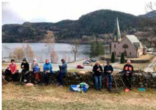
Fra matpause for store og små på dugnad i Kviteseid