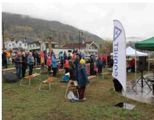
Frå felles gudsteneste i Bryggeparken etter godhetsveka.

- Takk til alle som deltok på godhetsveka med tenester eller som inviterte nokon heim til seg.