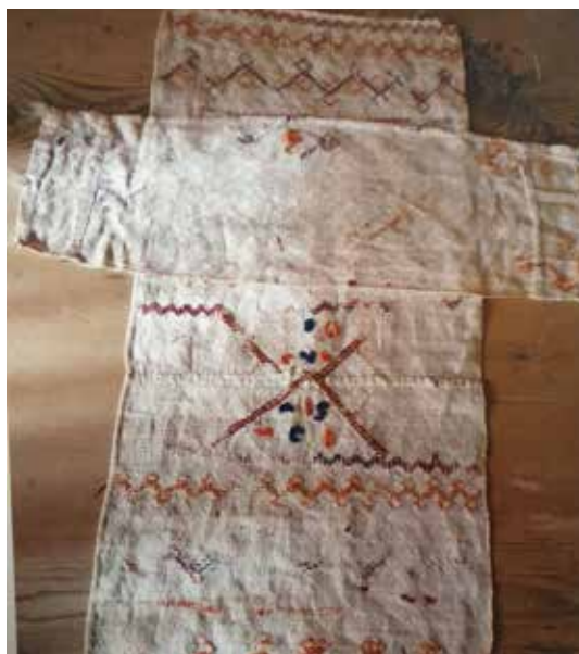
Kistekross frå 1770-talet