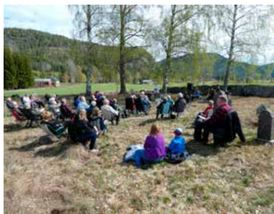
Frå Kristi himmelfartsdag på Vrådal gamle kyrkjegard, foto: ØAJ.