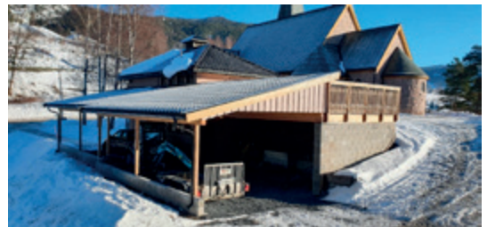
Ny carport ved bårhuset i Kviteseid