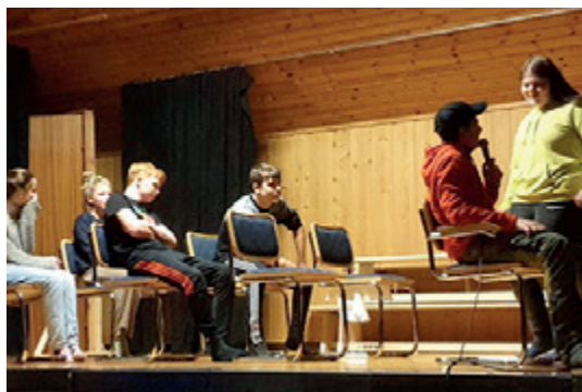
Frå underhaldningskvelden

Eg gjorde nokre intervju med konfirmantane der eg stilte dei spørsmål om leiren. På spørsmålet om det var moro på leir, svara alle ja. Eg spurde konfirmantane kva dei hugsa best frå leiren. Mange nemnde gruppe-konkurransen «konf. challenge». Dei ulike gruppene fekk mange forskjellige oppgåver og utfordringar, og til slutt vart ei av gruppene kåra til samanlagt vinnar. «Vintermeisterskap» var noko av det konfirmantane hugsa best. Her konkurrerte dei i aking, curling, snøborg og langrenn i blinde. Natursti vart også nemnt som ein favoritt fordi det var passe blanding av fysiske utfordringar og hjernetrim/kunnskapsoppgåver.