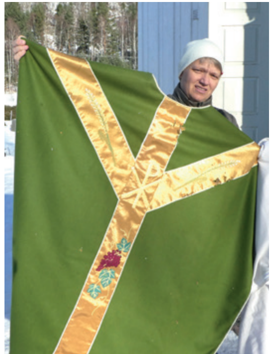
Musespist messehakel