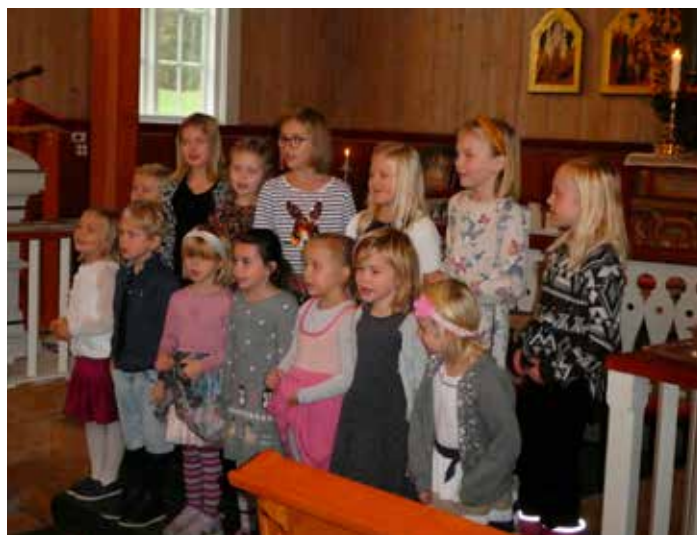
Her syng barnegospel på gudsteneste i Vrådøl

I Kviteseid Barnegospel kan ein vere med frå hausten i det året ein fyller fem, og ut fjerde klasse. No er det 18-19 born som er med på øvingane. Det er ei dobling frå i fjor, men det er plass til fleire. Samlingane er på Misjonshuset annankvar torsdag mellom kl. 17 og 18, og det er gratis å vere med.