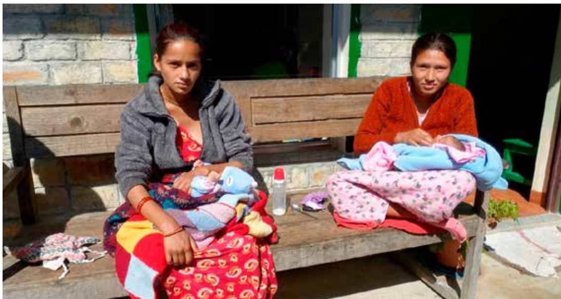
To nybakte mødrer varmar seg i sola utanfor sosialkontoret

Når det er jol, synest eg alltid det er ekstra spesielt å vere jordmor. Å tenkje på Maria, tenåringsjenta, som fødte i ein stall. Eg ser for meg at det i tillegg til Josef må ha vore eit par englar der, som ikke bare song og jubla, men som passa på Maria og Jesus, at alt gjekk bra med den unge mora og den nyfødte guten. Det er utruleg, at Jesus “flytta inn i menneska sine grannelag” på den måten. Det er han vi prøver å fylgje.