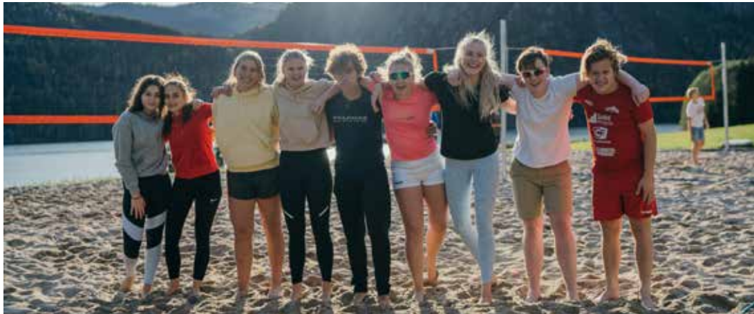
Elevar som gler seg på sandvolleyball-banen på Kvitsund.