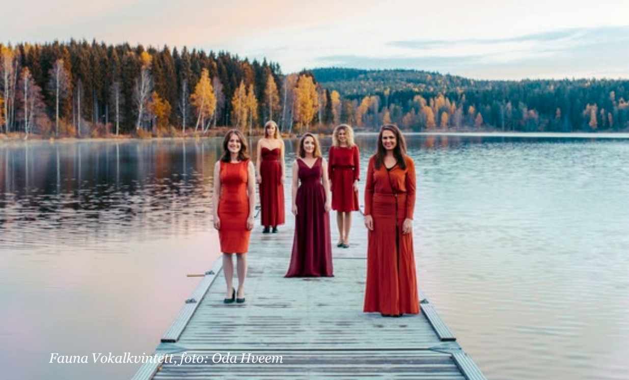
Fauna Vokalkvintett