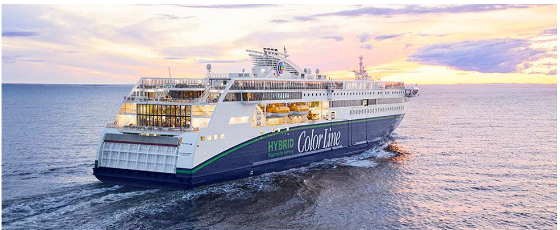
Color Hybrid, arbeidsplassen til Solveig.