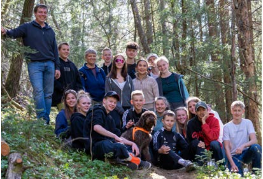
Årets konfirmantar på pilegrimstur