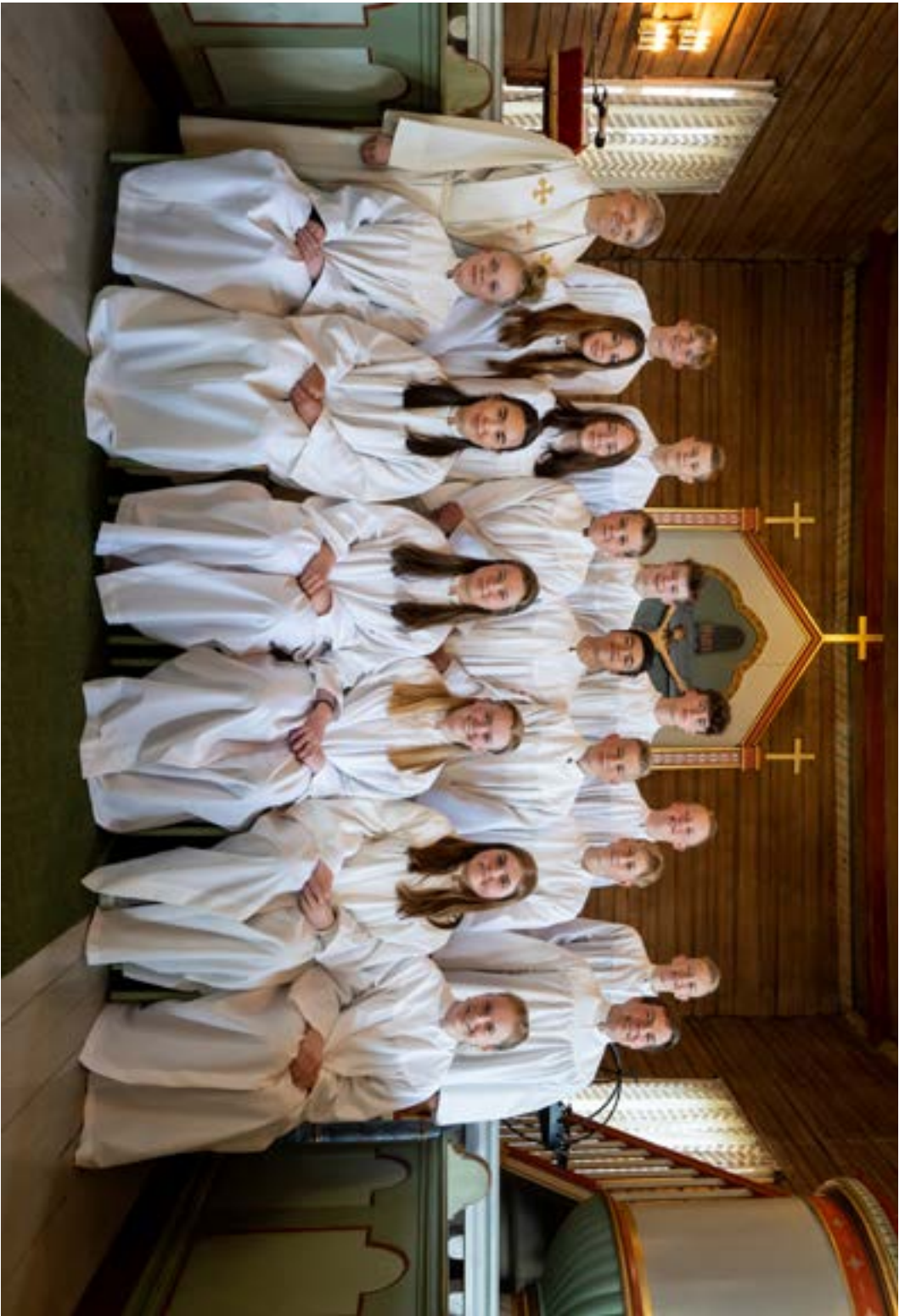
Konfirmanthiletet 2022