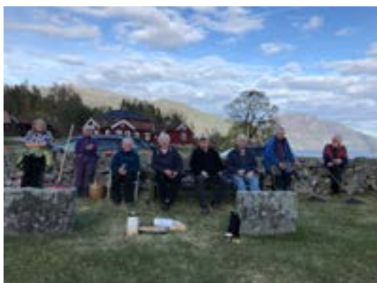
Flott arbeidsgjeng ved Kviteseid gamle kyrkje, foto: Marit Gotuholt