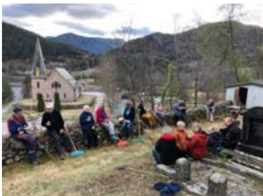
Koseleg kaffepause på dugnaden ved Kviteseid nye kyrkje