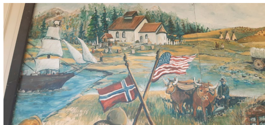
Kviteseid gamle måla som ein del av utvandrarhistoria