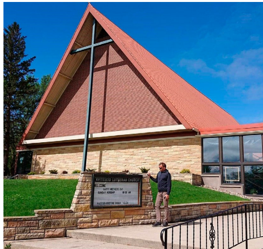
Kviteseid Lutheran Church

Då eine sonen vår valde å utdanne seg i USA, vart det til at vi reiste over i 2015. Dette førte då til møter med slekt og opplevingar av ulike slag, som gjorde til at tankar om ein ny tur dukka opp. Etter nokre år med pandemi vart det endeleg anledning att i 2022. Med 16 dagar til rådighet gjaldt det å planlegge godt for å sjå og oppleve mest mogleg.