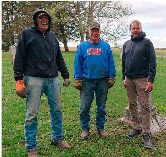
To fornøgde frivillige

Mangt og mykje er skrivi om utvandringa til USA på 1800 talet, røtene våre til det amerikanske folket og dei mange møtene mellom slekter i åra etterpå. I min eigen familie er det også slik. Mi mor (født Askedalen) hadde to tanter og ein onkel som alle reiste for å søke betre kår. Min eigen bestefar reiste også, men kom tilbake til heimlandet av ulike grunnar. Nokre tankar om kvar ein «tilfeldigvis» veks opp kjem til ein når ein tenker på dette.