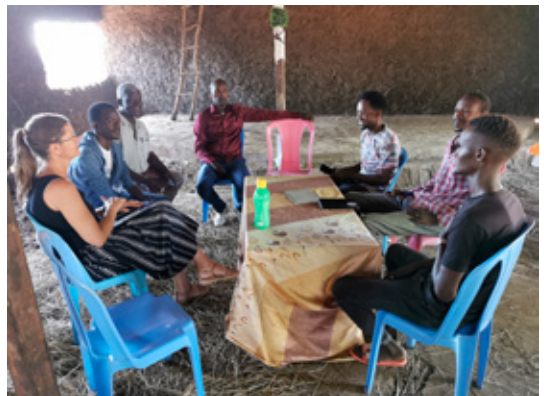
Møte med eldste-rådet i ein kyrkjelyd i Sør-Omo.