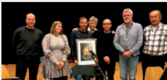
Jolekonsert med "No Boots"