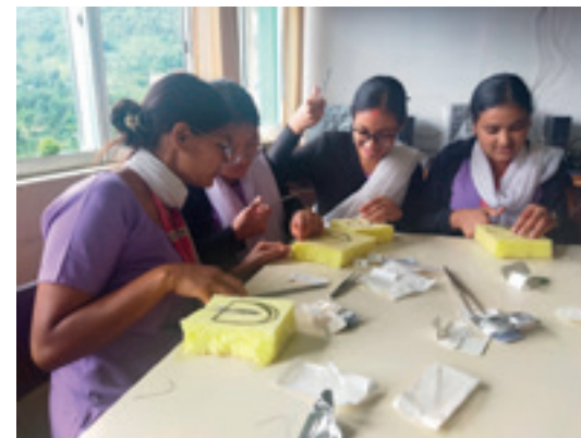
Sutureringskurs med studentane.

Livet i Okhaldhunga er mangfaldig og kjennest som i stadig endring. Men det viktigaste eg har vore med på her – og det de i Kviteseid har vore med å støtte gjennom Kyrkjelydens Misjonsprosjekt – er utdanning av nye sjukepleiarar. Okhaldhunga Community Hospital starta opp ein sjukepleiarskule for fire år sidan. Jordmorfaget er ein stor del av tredje året på sjukepleiarstudiet i Nepal. Som jordmor var planen at eg skulle følge avgangsstudentane, i undervisning og oppfølging i praksis. Då eg flytta til Okhaldhunga i april 2021 hamna eg midt i deltabølgja av covid. Alt utanom sjukehusdrifta blei sett på vent på ubestemt tid. Men her som overalt elles opna skulen og samfunnet etter kvart opp igjen og kom sakte i gang. Då fekk eg dei to første kulla med avgangsstudentar, til saman 39 studentar, å undervise i jordmorfag og følgje opp i praksis på føden. Det første kullet var ei spesiell gruppe; dei var alle på stipend frå styresmaktene, fordi dei hadde utmerka seg med gode karakterar og var frå marginaliserte grupper. I år har vi éi avgangsklasse, med 20 studentar. Det har vore, og er, eit sant privilegium å følgje desse studentane, sjå dei vekse i kunnskap og dugleik og bli meir trygge; sjå når noko plutselig klikkar på plass for nokon i praksis, som dei har lært om i teori; forsøke å formidle at det ikkje berre handlar om dugleik heller, men om ei haldning av respekt for dei vi møter