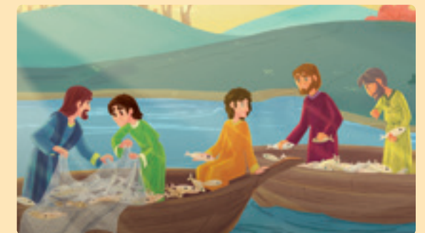
Teikning: Claudia Chiaravalloti

Gje barnebladet BARNAS til eit barn du er glad i!