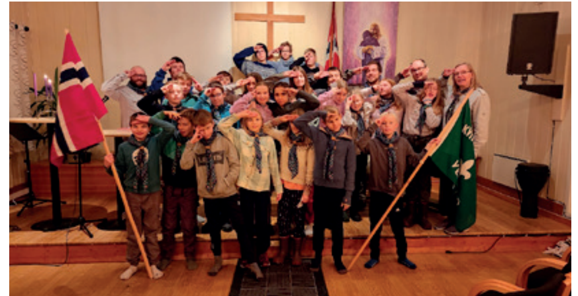
Speidargruppa gjer speidarhelsing etter å ha gjeve speidarløftet i 2023.