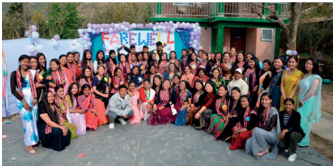
Heile sjukepleiarskulen på avslutningsfesten for dei to første kulla.