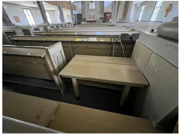
Teknikerplass med pult til lyd og lyskontroll.