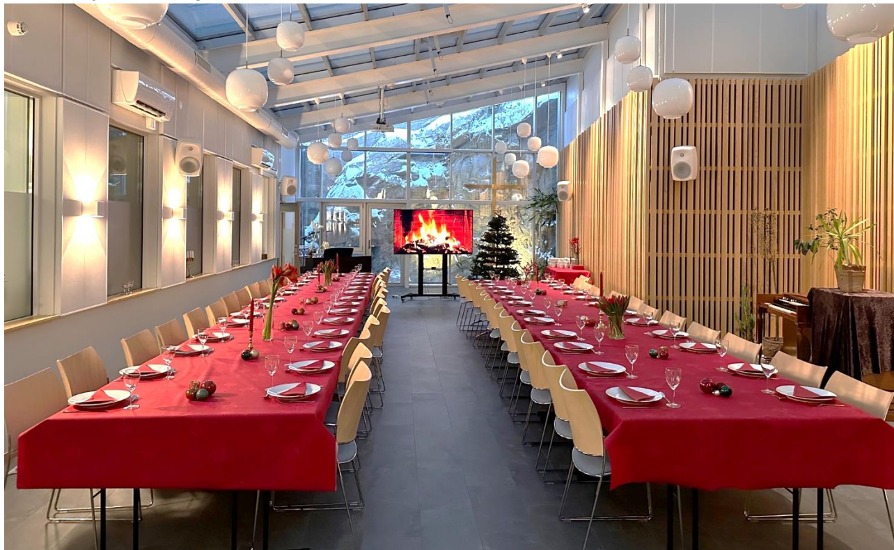
Klosterhaven på Kirkesenteret i Mandal pyntet til julebord for staben i desember 2022.

9. juni arrangerte vi sommeravslutning med tur til Ryvingen for hele storstaben. Turen ble en stor suksess. Julebord med konsert i den gamle kinoen som oppvarming den 16. desember ble også et svært vellykket arrangement.