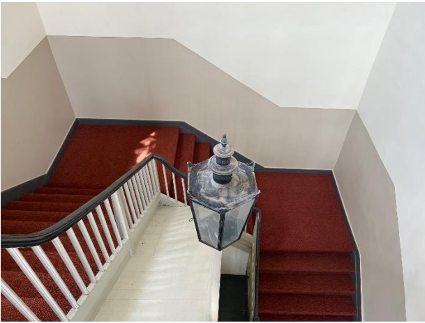
Nye heldekkende tepper i trappene til galleriet.