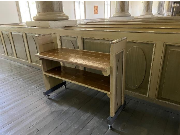
Trillebord til kirkecaffe.