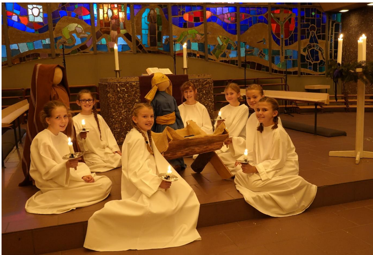
Gruppe fra Barnekoret på opptak til adventsgudstjeneste lagt ut på Facebook 20.des.