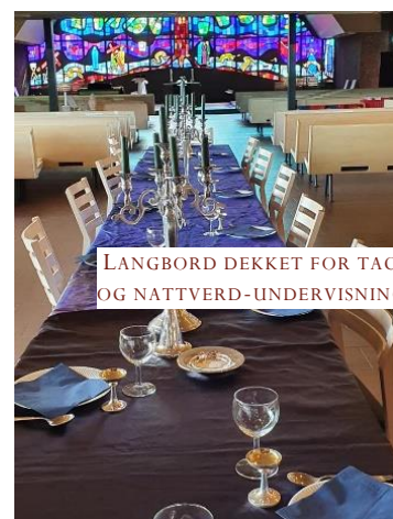
LANGBORD DEKKET FOR TACO OG NATTVERD-UNDERVISNING