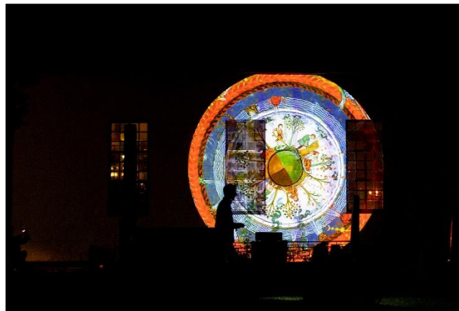
Noen bilder fra forestillingen, tatt av De Utvalgte og Hans-Jürgen Schorre