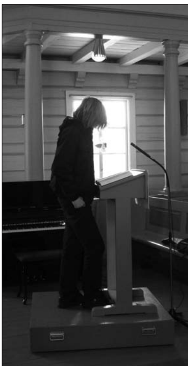
Simen fra klokkergruppa øver på tekstlesing