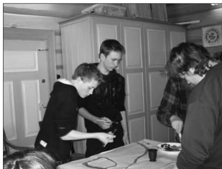
Formingsgruppa i arbeid