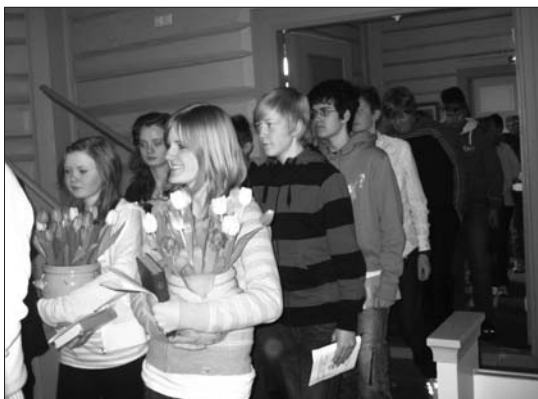
I prosesjon på vei inn i kirka til samtalegudstjeneste