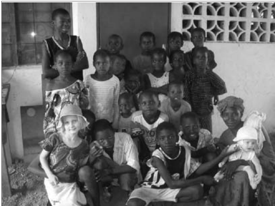
Barna fra Sosabatunet kom for å ta avskjed før vi reiste

esserte i å vite mer selv om de bor langt unna.