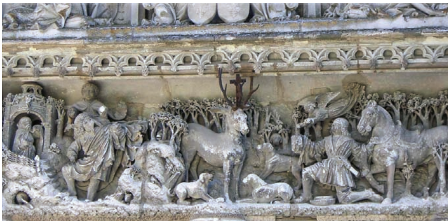
Hubertusmotiv på fasaden til Saint-Hubertkapellet i slottet i Amboise i Frankrike

Programmet for kvelden er variert, og vakre Nordsinni kirke er altså stedet å reise til denne kvelden.