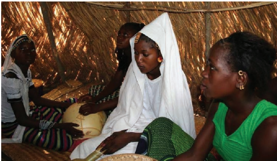
Bruden inne i hytta med brudepikene sine

hadde fått, masse gryter og kar, såper og klær. Og så var det mer tam-tam og dans helt til natten.