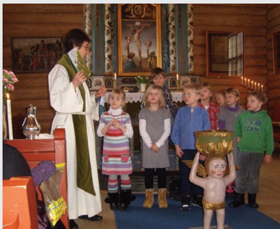
Utdelig av bok