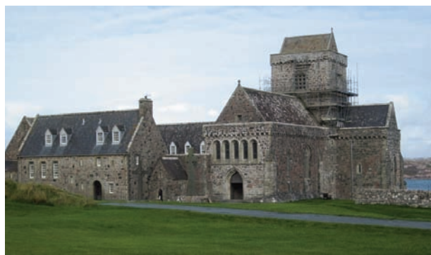
Klosterbygningen i dag