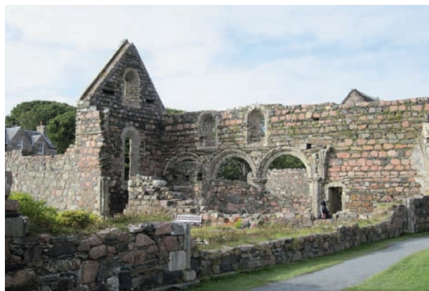
Nonneklosteret er fortsatt bare ruiner

ikke greide å møte mennesker på steder der arbeidsløsheten var stor. Han ordnet det slik at en gruppe prester og arbeidere kom til Iona sommeren 1938. I tre måneder skulle de arbeide med å bygge opp klosteret. Hvert år ble en ny gruppe sendt ut på samme oppdrag. Erfaringene de gjorde seg under livet på øya, skulle tas med tilbake til deres lokale kirke og sam-