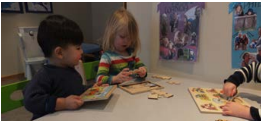
Etter frukt må det lekes litt!