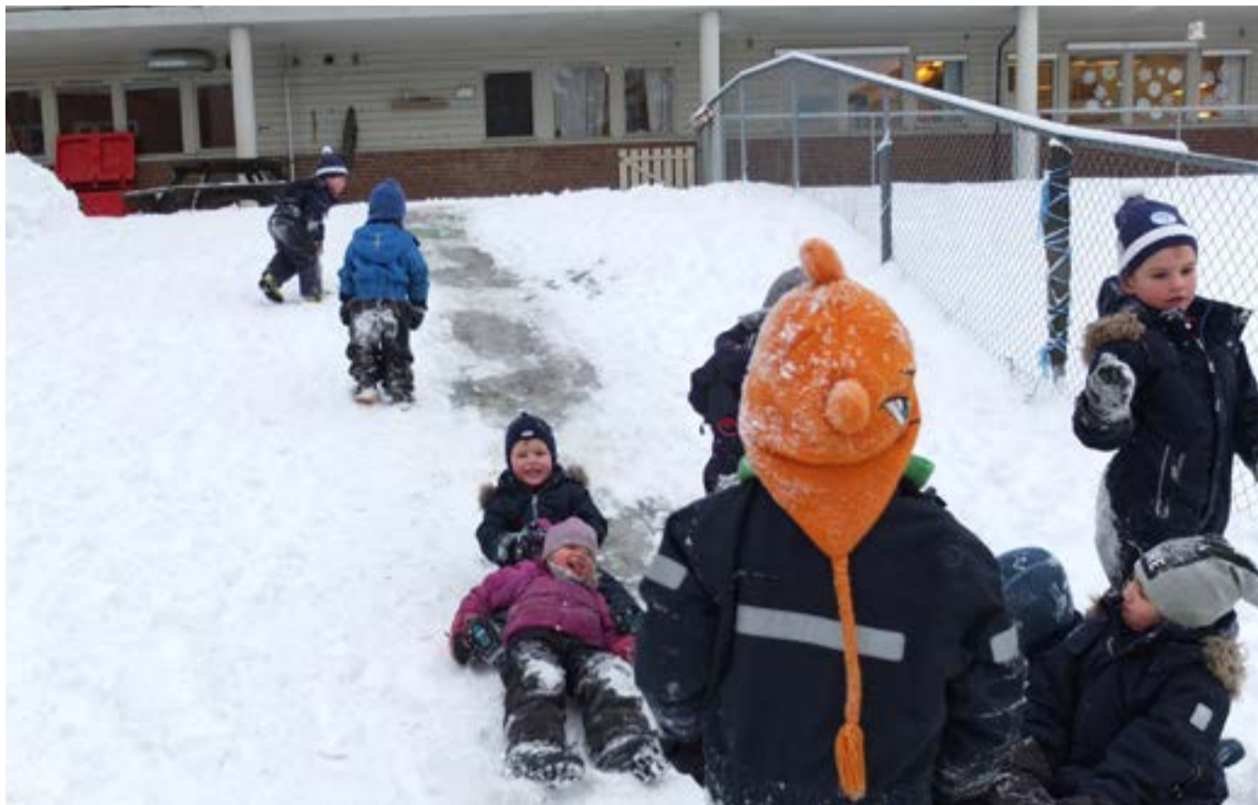
Lek er en naturlig del av barnehagen, og en selvfølge i nysnøen.