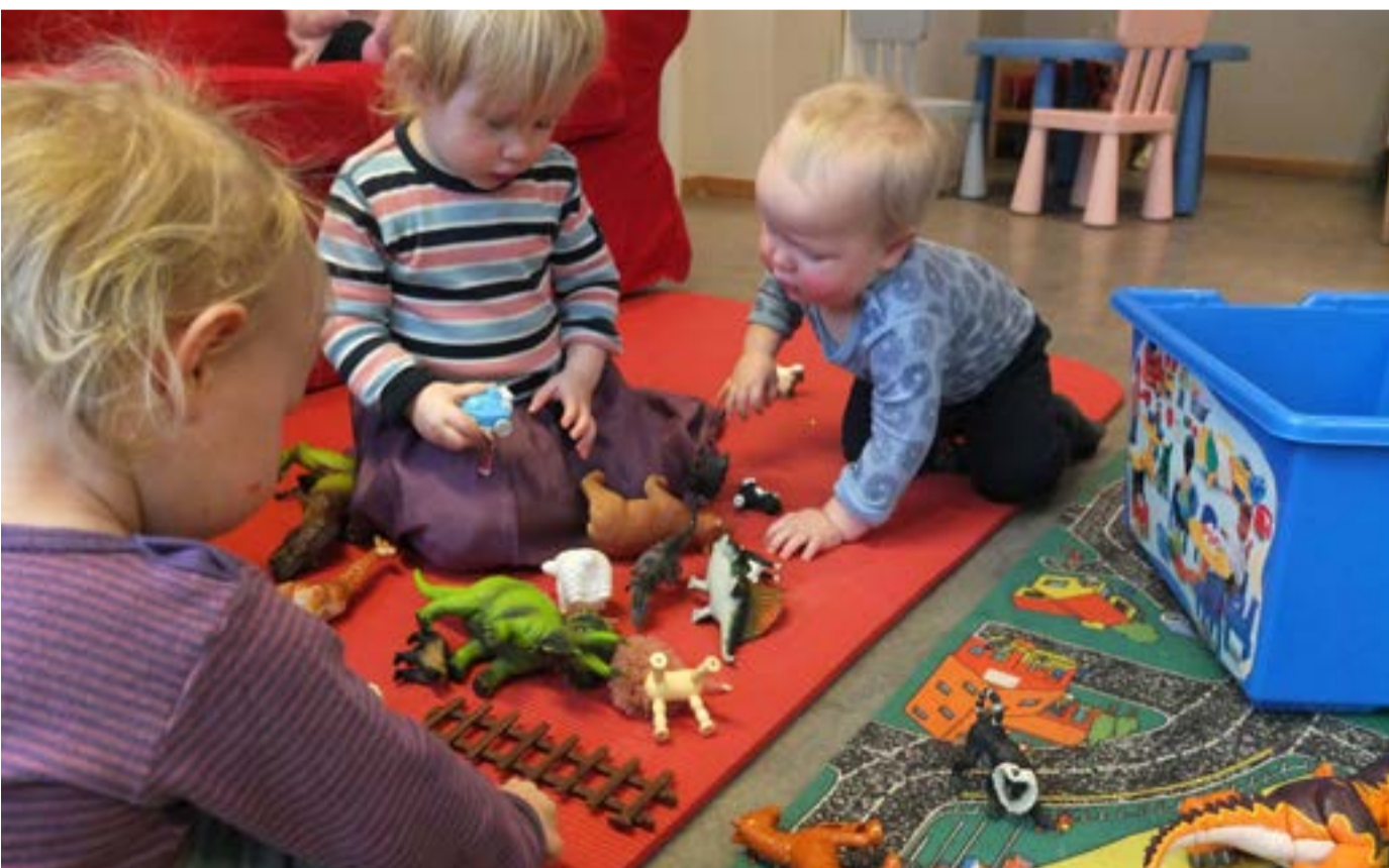
Lek er en viktig del av hverdagen i barnehagen