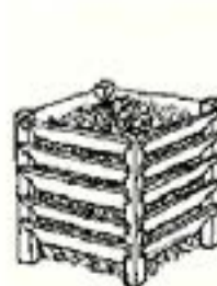
Lukket, isolert bing