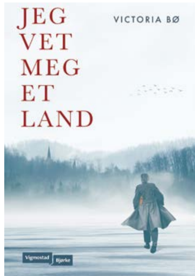
Boken gis ut av forlaget Vigmostad&Bjørke og ser slik ut.

Boken «Jeg vet meg et land» kommer ut i februar og undertegnede kan i hvert fall anbefale den!