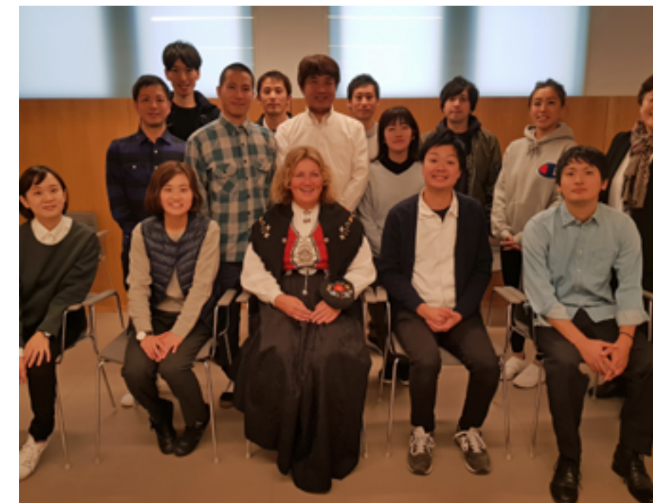
Fra årets besøk på Bekkelagshjemmet.