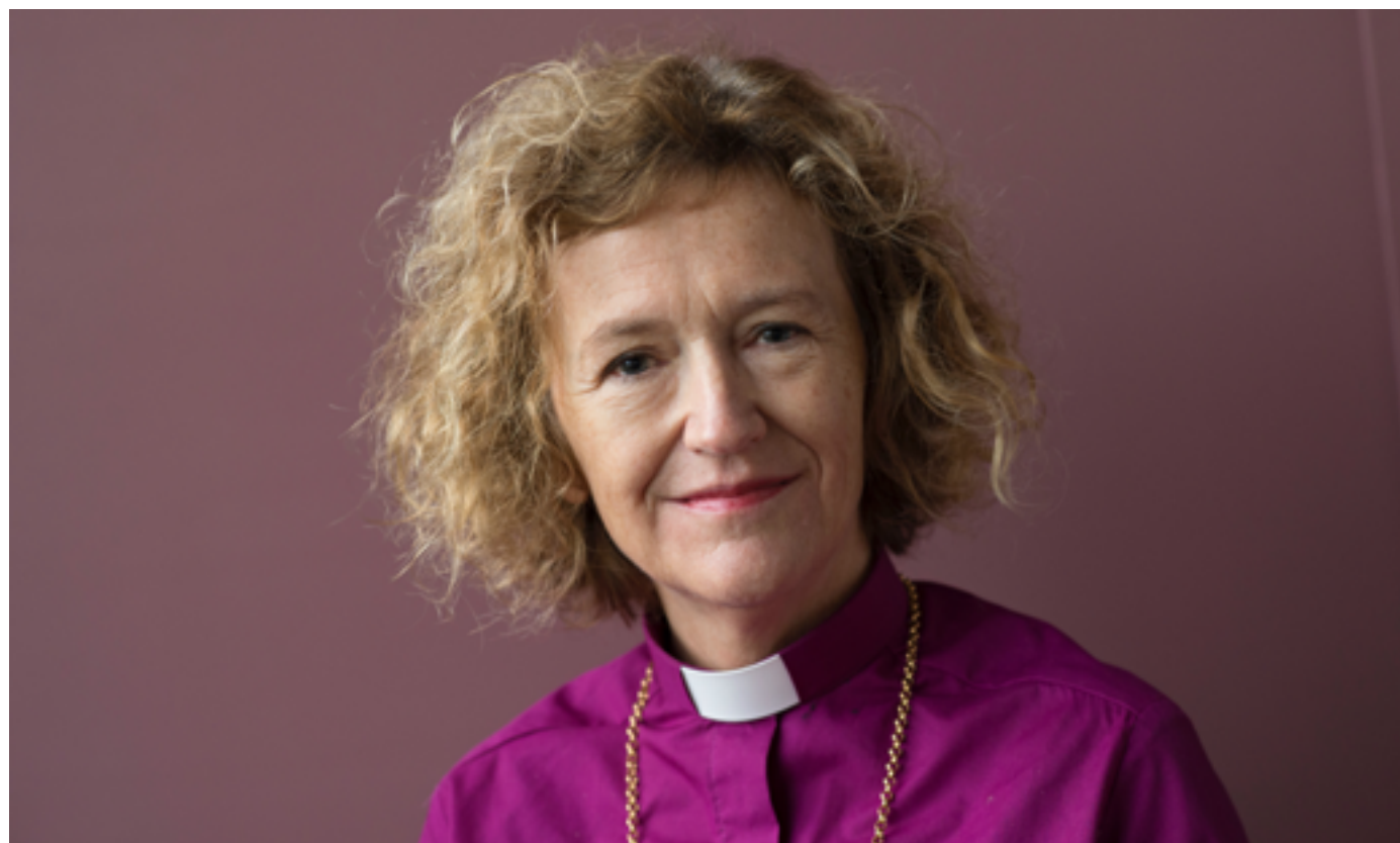
Biskop Kari Veiteberg.

Vad som än oss händer vil dom ge oss kraft och mot