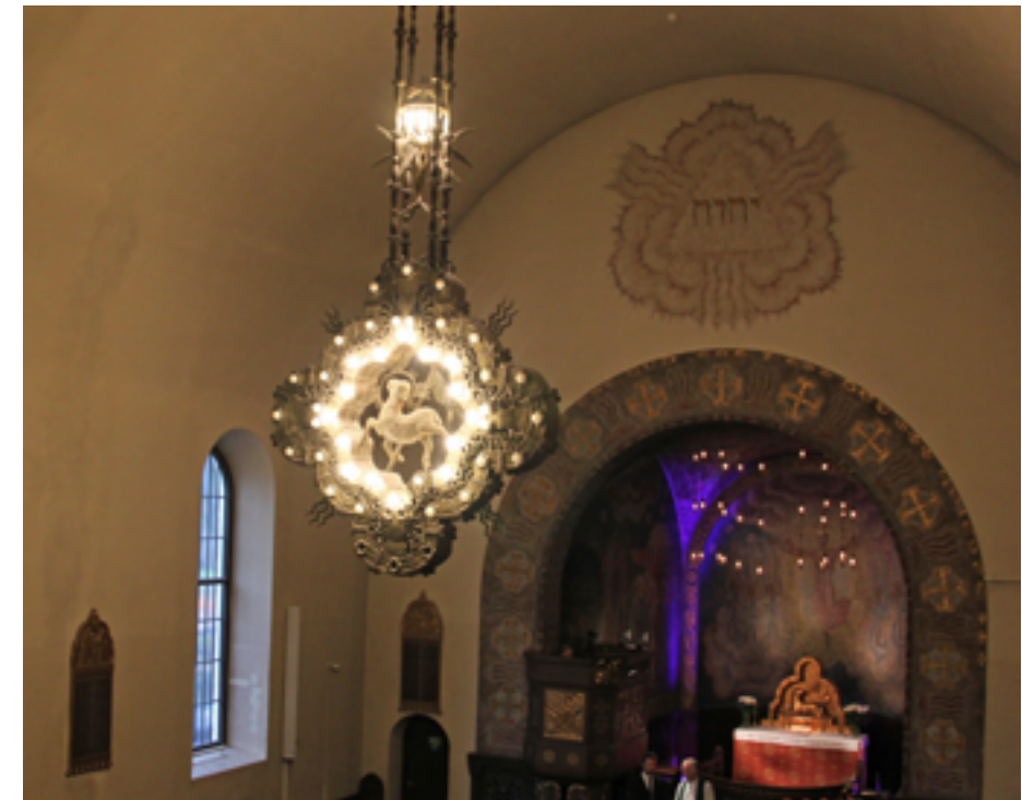
Lyskransen i Bekkelaget kirke.