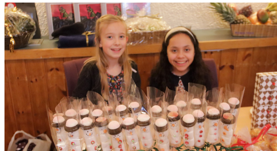
Glade selgere på julemessen.