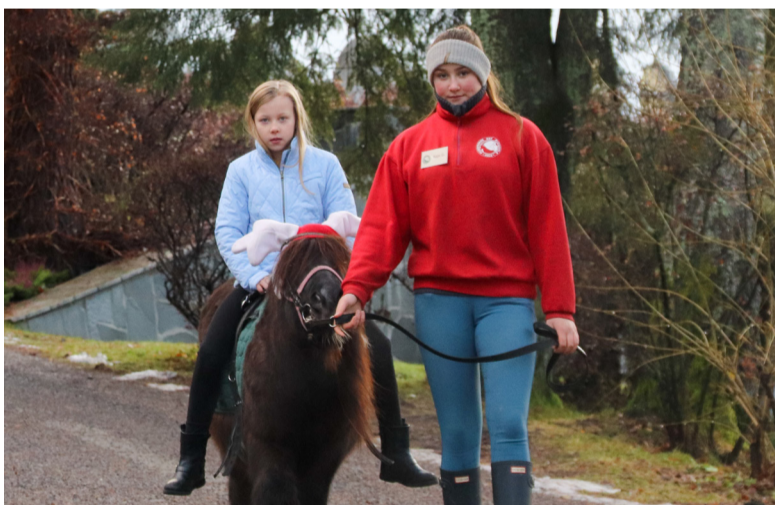
Populært med ridetur rundt kirken.

Takk til dere alle sammen fra Julemarkedkomiteen