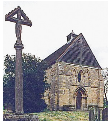
Kirkstead Abbey i Lincolnshire.

gudstjenesten er en tradisjonell førjulsgudstjeneste i Storbritania med lesing av juletekster og sang av julesanger. Kirken var pyntet med levende lys og kristtorn, og det var levende musikk. Det var utrolig stemningsfullt, og vi følte en veldig sterk kobling til Ormøy og Norge. Tradisjonen tro var det selvfølgelig kirkekaffe på nabobondens gård med fyr på peisen og servering av mince pais and mulled wine. Så ble det jul i fremmed land.