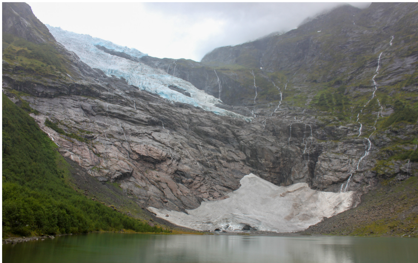
Bøyabreen, en arm til Jostedalsbreen.

Jeg blir ofte fristet til å tenke at dette finner jeg ut av selv, jeg trenger ikke innspill eller tips