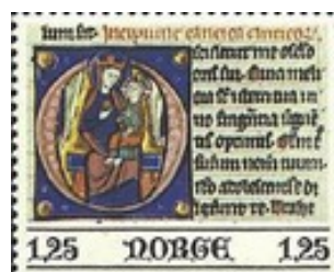
Fra Aslak Bolts bibel

Tradisjonen med familie bibler i bokhyllene er i dag langt mindre vanlig. Snaut halvparten av oss har en bibel i huset, og færre vil det bli etter hvert som trykte bøker forsvinner mer og mer. Likevel, det selges mellom 50.000 og 60.000 bibler i Norge hvert år.