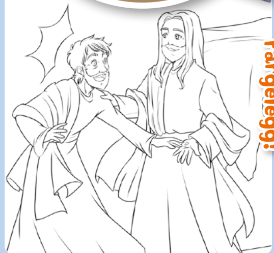
Tegning: Chiara Bertelli