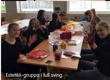
Estetikkggruppa i full sving.