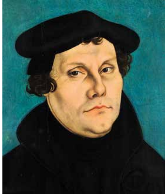
Portrett av Martin Luther, malt av Lucas Cranach den eldre.

I år skal vår kirke og hele den lutherske kirkefamilien markere 500-års jubileet for reformasjonen. Men hvem og hva er det vi skal feire? Er Luther aktuell i vår tid?