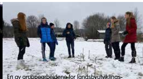
En av gruppearbeidene for landsbyutviklingsoppgaven knyttet til forvaltning av vår jord.