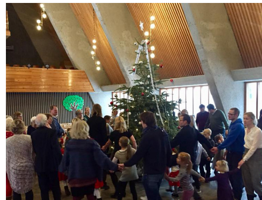
Bilder fra Mangerud kirkes tidligere julearrangementer. Øverst: Juletreet pyntes. Nederst: Juletrengang på menighetens julefest.