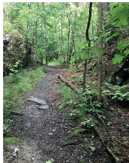
Noen meter overfor Ljabruveien finnes ennå den vakre bekkedalen der Pilbekken i sin tid bruste gjennom skogen.

Kilder: Kjell Kobro; Inger Bjørbæk Mikkelsen; Kart over Østmarka, utg. av Akersbanerne A/S, trykket 1931; Nordstrand sogns villakart, midtre del, 1932 (illustrasjon).