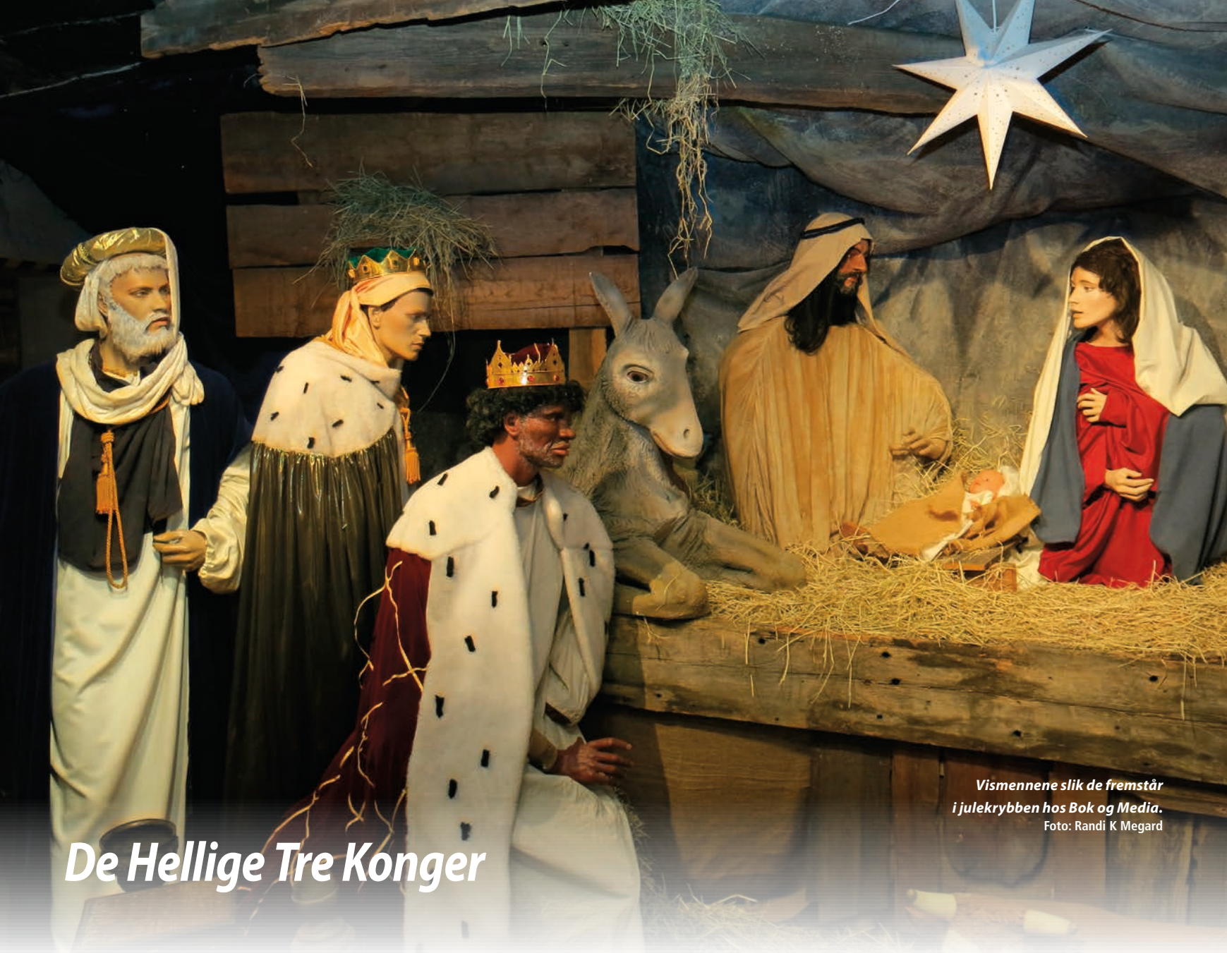
Vismennene slik de fremstår i julekrybben hos Bok og Media.