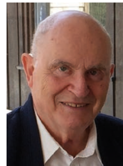
Cand. theol, 1963. Prest 1964-74, sjefredaktør i Vårt Land 1974-85, Red.sekr. Aftenposten 1985-2000. Har utgitt bl.a. «Evangeliet og religionene» (1967), «Tronarvingene» (2001) og «Josef fra Nasaret» (2002).