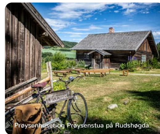
Prøysenhuset og Prøysenstua på Rudshøgda.

9. juni: Sommertur til Prøysenhuset og Prøysenstua på Rudshøgda. Lunsj. Påmelding til diakonen