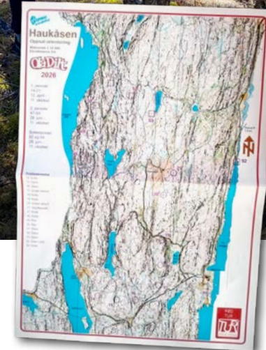
Eksempel på Ola Dilt-kart, fra Oppsal orientering/ Ola Dilt.